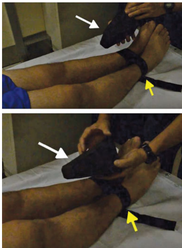
Fig. 2 Após a colocação da fita de Velcro (setas amarelas) em volta dos tornozelos à altura supramaleolar, a atenção é dedicada à aplicação do estresse em varo no joelho. O triângulo de espuma (setas brancas), feito com etileno acetato de vinila, é colocado entre os joelhos. É importante assegurar o posicionamento da base do triângulo à altura da tuberosidade tibial e da ponta do triângulo à altura do fêmur distal.

Após a colocação da fita de Velcro em volta dos tornozelos, à altura supramaleolar, o triângulo de espuma (► Fig. 2) é usado para aplicação do estresse em varo no joelho. Assegurando o posicionamento correto dos membros, o triângulo de espuma (feito de etileno acetato de vinila) é gentilmente colocado entre os joelhos que estavam bem próximos. O aspecto menor da espuma (ponta) fica em direção proximal, enquanto a base do triângulo continua à altura da tuberosidade tibial. O médico deve assegurar que os maléolos mediais estejam em contato, e que a fita de Velcro não mude a posição. Ao inserir a espuma