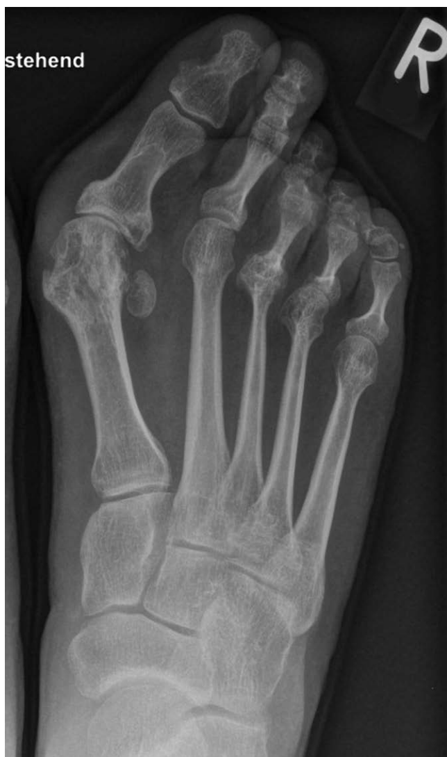
► Abb. 2 rheumatischer Fuß einer jungen Patientin mit guter Krankheitskontrolle

Yano et al. konnten für eine closing wedge Osteotomie an 105 rheumatischen Vorfüßen eine Rezidivrate von 10,5% finden, die Überlebensrate nach gelenkerhaltender Operation betrug 89,5% nach 7 Jahren [11].