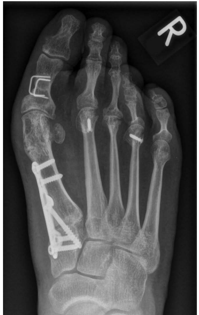
► Abb. 4 Patientin nach einem ¾ Jahr und zwischenzeitlich massivem Krankheitsschub. Es zeigt sich die Rezidivfehlstellung v. a. im arthritischen Gelenk des MTP IV.

Als Alternative zum Reg Joint Spacer ist der von Swanson in den 1960er Jahren entwickelte Silastikspacer zu nennen mit einer Überlebenszeit von 87 % nach 10 Jahren [17]. Die Implantation von Swansonprothesen führte zunächst zur Schmerzreduktion und somit zur weitgehenden Zufriedenheit der Patienten. Aufgrund zunehmender Misserfolge mit Fremdkörperreaktionen, abriebbedingten Osteolysen und Prothesenbrüchen kam man zur Erkenntnis, dass sich Silikonimplantate auf Dauer nicht für gewichtstragende Gelenke eignen [18].