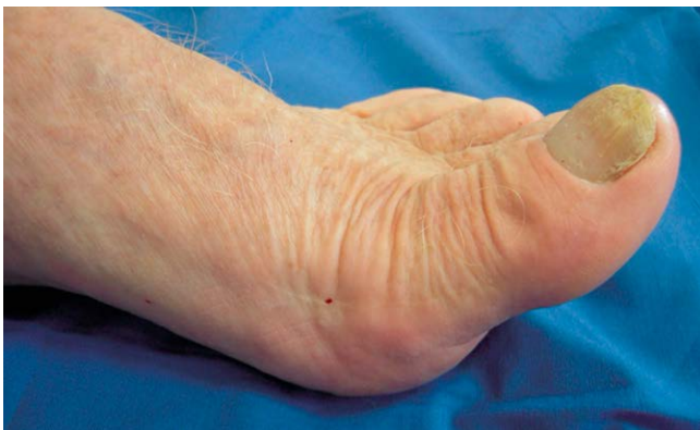
► Abb. 6 klinisches Bild 10 Jahre nach Reg Joint Implantation