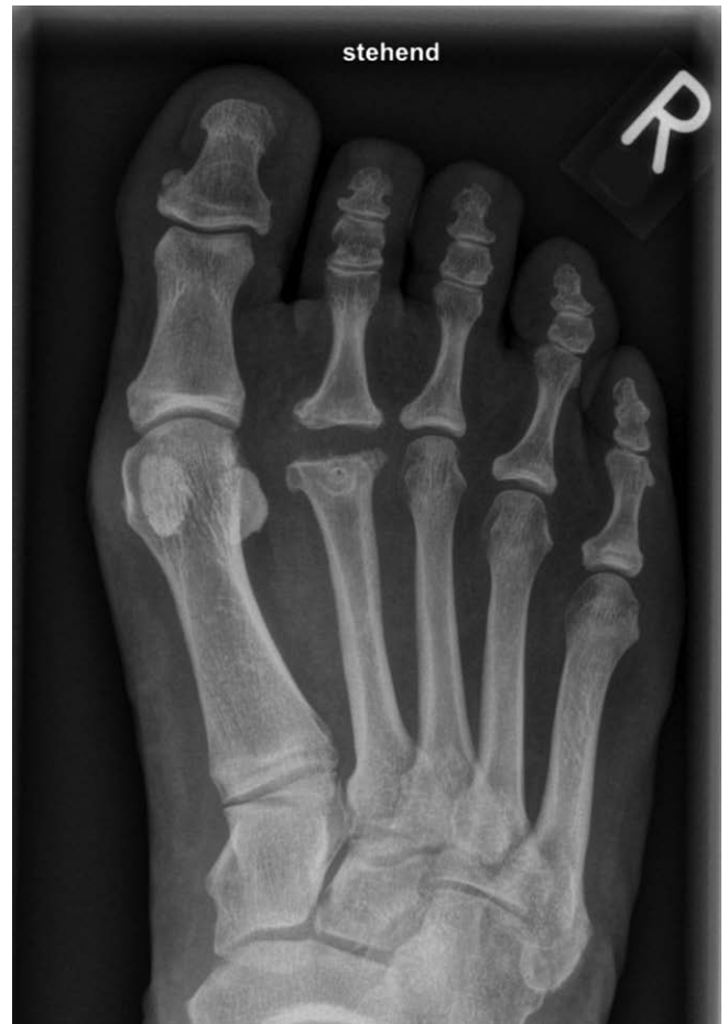
► Abb. 8 postoperatives Röntgenbild 9 Monate postoperativ mit gut erhaltener Gelenksalthöhe.

Für die Behandlung der Arthrose im Großzehengelenk hat sich ebenfalls die Arthrodese mit einer Schraube bewährt. Einzig bei der schmerzhaften IP Arthrose und bereits arthrodiesiertem Großzehengrundgelenk hat sich die zusätzliche Arthrodese des IP Gelenk als problematisch herausgestellt. Eine Möglichkeit besteht in der Implantation eines Reg Joint Spacers in das IP Gelenk.