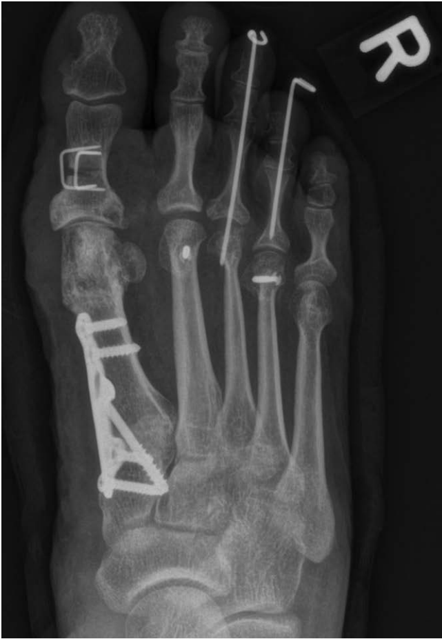
► Abb. 3 postoperatives Bild nach gelenkerhaltender Operation, aufgrund intraoperativer Destruktion musste am MTP III Gelenk anstelle einer Weilosteotomie eine sparsame Köpfchenresektion erfolgen.