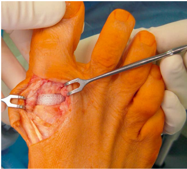
► Abb. 5 Reg Joint Spacerimplantation.