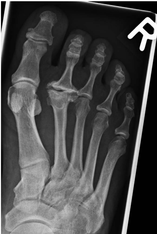
► Abb. 7 Morbus Köhler II präoperatives Röntgenbild.

endgelenk ist der Arthrodese des distalen Interphalangealgelenkes (DIP) der Vorzug zu geben.