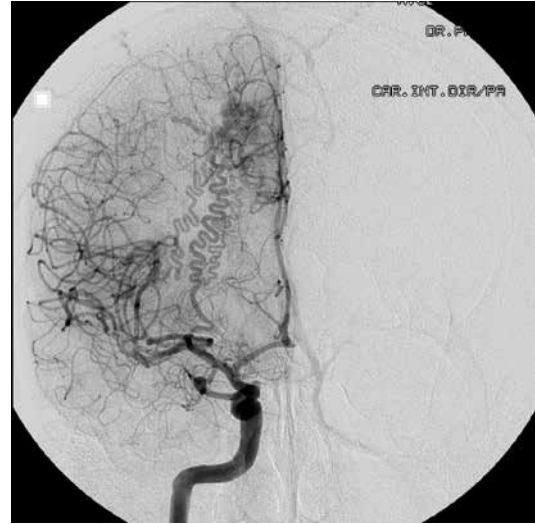
Figura 1 – Angiografia de artéria carótida interna direita em anteroposterior demonstrando FAVCT.

Desse modo, permanece sendo visto no consultório de neurocirurgia vascular anualmente, assintomático até o momento e sem haver aumento da lesão (Figuras 1, 2 e 3).