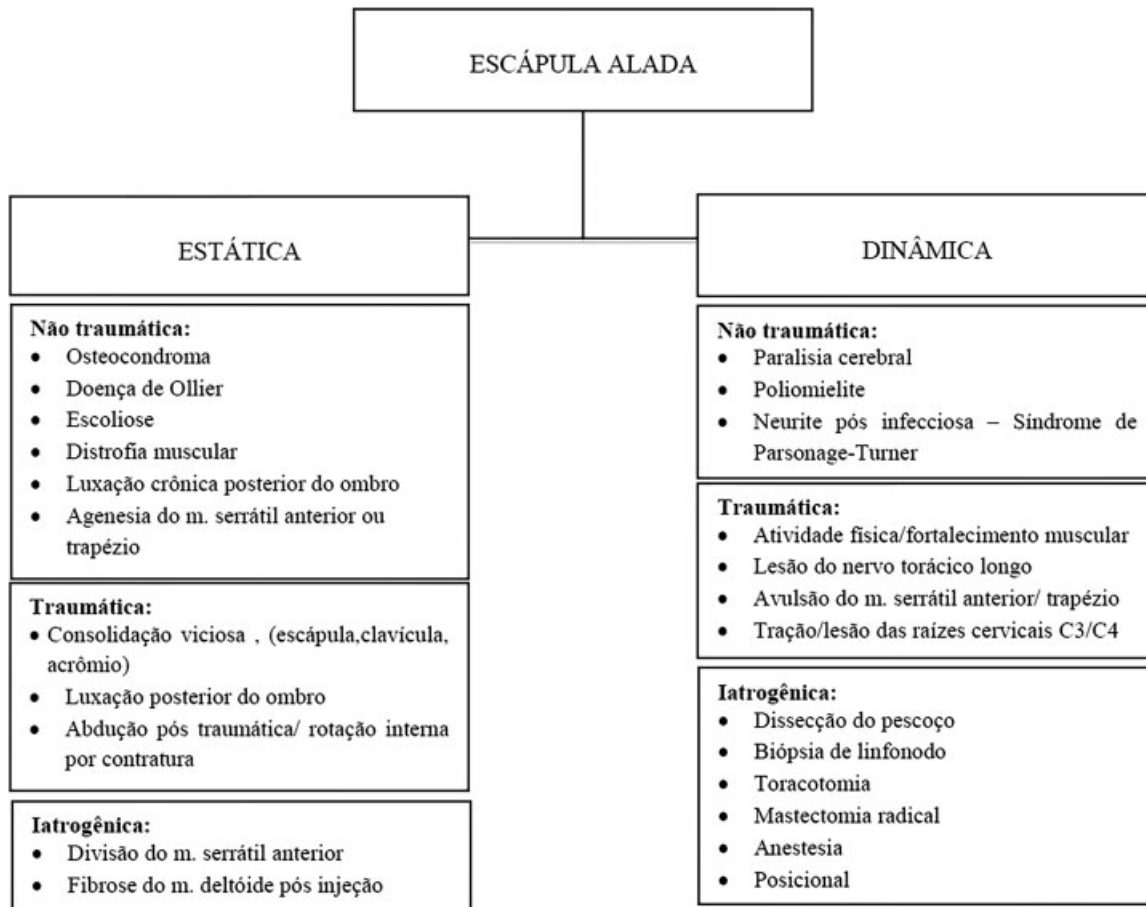
Fig. 4 Diagnósticos diferenciais de escápula alada.

inflamatória da mesma. 18 Orlow, 19 em 1891, foi o primeiro a descrevê-la, usando o termo “exostose bursata” para esta localização. No presente estudo, deparou-se com três casos com formação de bursa. Destes, dois apresentavam dor nesta região, o que pode ser um fator de suspeição, pois dentre aqueles que não a apresentavam (57%), só um referia dor.