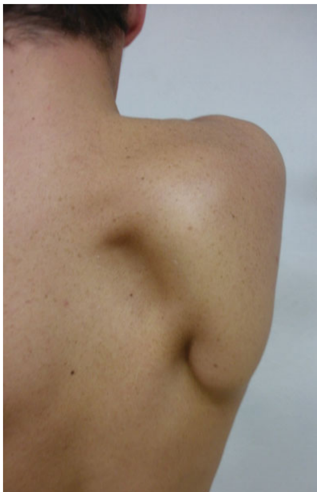
Fig. 2 Imagem clínica do osteocondroma retroescapular.