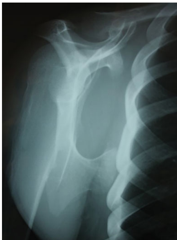
Fig. 1 Radiografia axial da escápula apresentando o osteocondroma no terço médio do seu aspecto anterior.

O presente trabalho é considerado uma série de casos analítica, descritiva e retrospectiva.