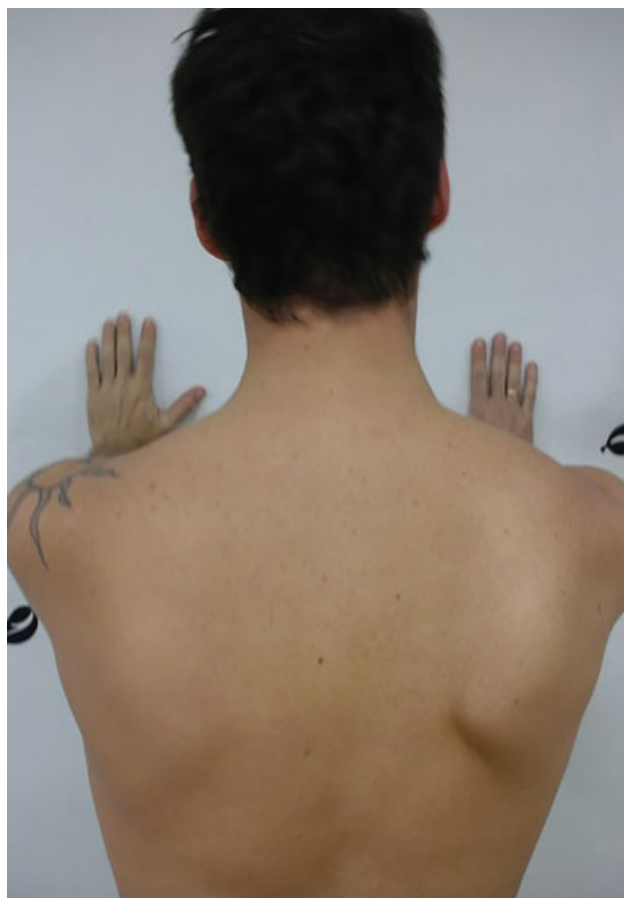
Fig. 3 Imagem clínica da escápula alada.

A malignização do osteocondroma é incomum. Nas formas solitárias, ocorre em ~ 2%, e para as formas múltiplas, em ~ 27%. 16 A literatura enfatiza que a espessura da capa cartilaginosa é fator preditivo da agressividade, ou seja,