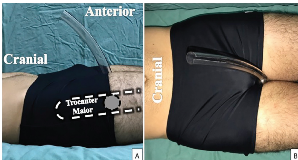
Fig. 2 Posicionamento da esfera entre as coxas, no plano do trocânter maior, vista em perfil (A) e vista anterior (B).

Os intervalos de confiança (ICs) nesse trabalho foram construídos com 95% de confiança estatística. A amostra com N