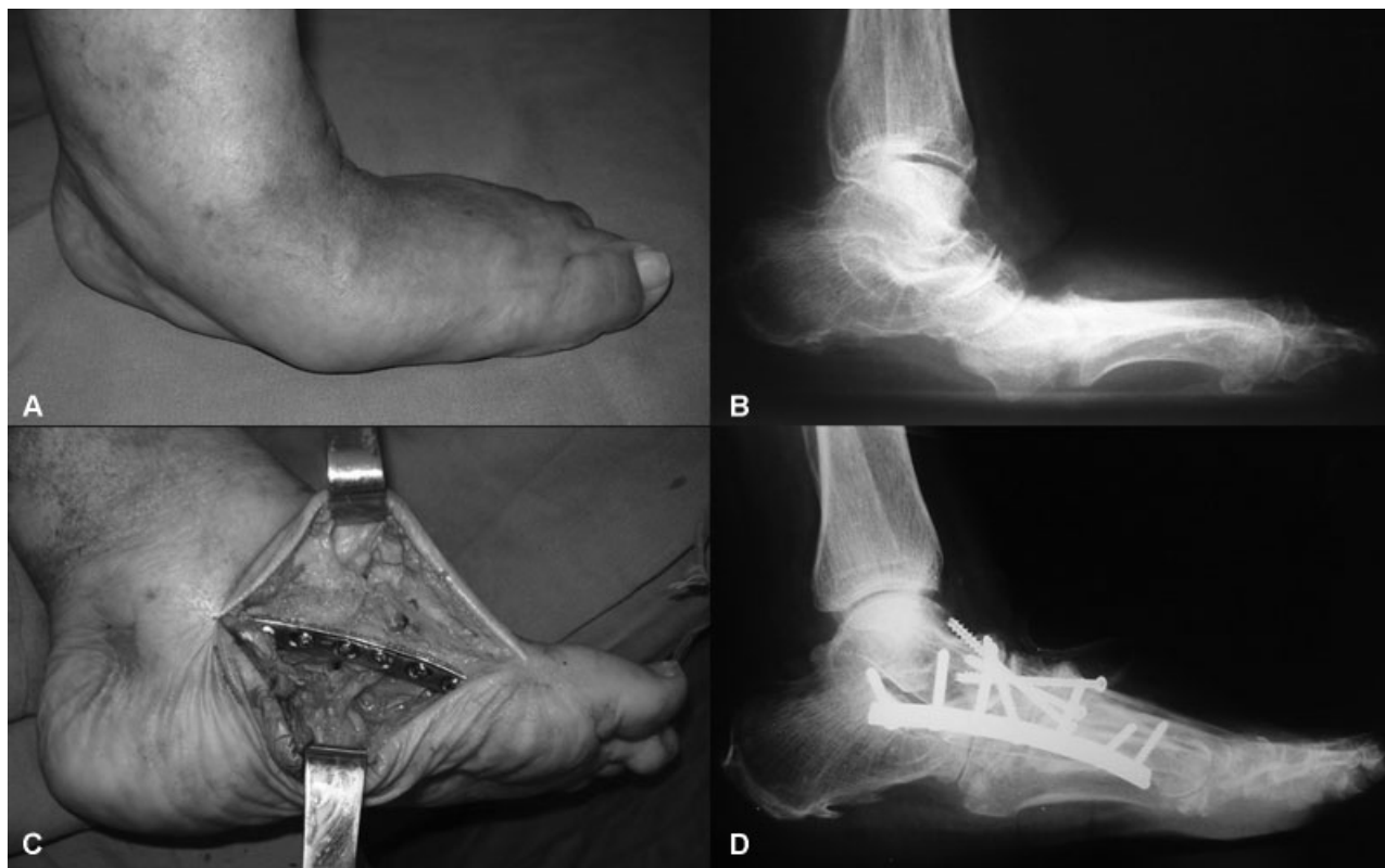
Fig. 1 Aspecto clínico (A) e imagem radiográfica em incidência lateral do pé esquerdo realizada com apoio (B) de um paciente com neuroartropatia de Charcot afetando o mediopé (tipo I da classificação anatômica de Brodsky 4 e Trepman 22 ). Observem a acentuada deformidade em abdução (A) e o grave colapso do arco com proeminência óssea plantar (A e B). O tratamento cirúrgico consistiu na artrodese modelante do mediopé por meio de abordagem medial para a ressecção de cunhas ósseas e correção das deformidades (C), seguido de fixação interna com placa e parafusos (D).

debridamento do osso infectada e o segundo tempo na realização da artrodese modelante propriamente dita. 34