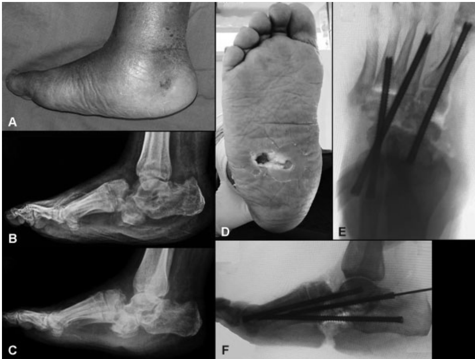
Fig. 2 Aspecto clínico (A e D) do pé direito num paciente com neuroartropatia de Charcot afetando o mediopé. As imagens radiográficas realizadas em incidência lateral do pé e tornozelo mostram que se trata de uma lesão do tipo II, segunda a classificação anatômica de Brodsky 4 e Trepman 22 (B e C). Tanto no momento da chegada do paciente (B) quanto 4 meses após o início do tratamento com gesso de contato total (C), podemos observar a presença de uma úlcera de pressão (D) causada pela proeminência óssea plantar do cuboide (C). O tratamento cirúrgico consistiu na ressecção completa do cuboide, seguido da artrodese modelante do mediopé utilizando parafusos para fixação interna, segunda a técnica intramedullary beaming (E e F).