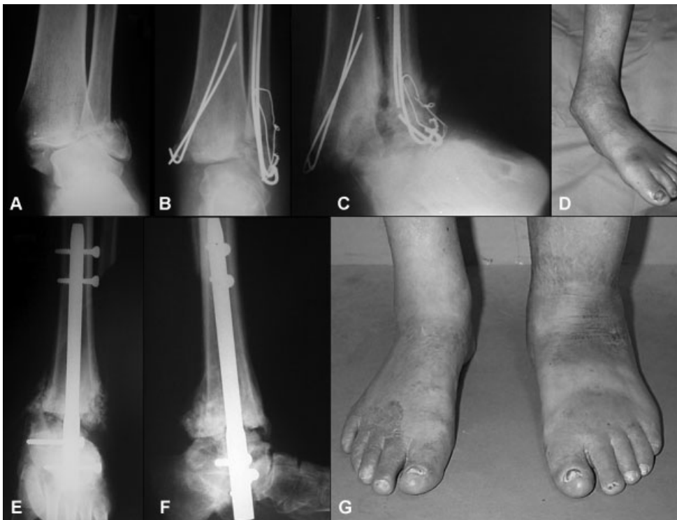
Fig. 3 Aspecto radiográfico anteroposterior do tornozelo esquerdo mostrando fratura bimalleolar instável (A), inicialmente tratada com redução aberta seguida de fixação interna por meio de cerclagem (B). Durante o acompanhamento pós-operatório, ocorreu destruição osteoarticular típica da neuroartropatia de Charcot do tipo IIIa, segunda a classificação anatômica de Brodsky 4 e Trepman 22 (C). O aspecto clínico mostra acentuado desvio em valgo do tornozelo (D). Artrodese tibiotalcanear modelante foi indicada tanto para corrigir a deformidade quanto para estabilizar o retopé. As imagens radiográficas do tornozelo, realizadas com apoio, demonstram que tanto na incidência anteroposterior (E) quanto na lateral (F) a consolidação óssea da artrodese encontra-se em curso. O adequado alinhamento e a estabilidade para o apoio puderam ser alcançados, como demonstra a imagem clínica (G).