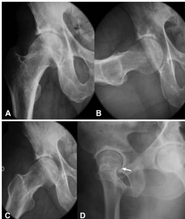
Fig. 3 Incidências radiográficas do quadril na pesquisa de IFA. (A) incidência anteroposterior. (B) incidência de Ducroquet. (C) Incidência de Dunn para visualização do came. Observe a retificação e a proeminência da região transição colo-cabeça. (D) imagem radiográfica da posição de Lequesne.

Sugere-se a realização de 5 incidências radiográficas para avaliação inicial do IFA: 1) AP de pelve; 2) Dunn com 45° de flexão do quadril e 20° de abdução em rotação neutra; 3) Lauenstein com o quadril entre 30° e 40° de flexão e 45° de abdução (planta do pé em contato com o joelho contralateral); 4) perfil de Ducroquet com flexão de 90° e abdução de 45°; e 5) falso perfil de Lequesne 35 (→ Fig. 3).