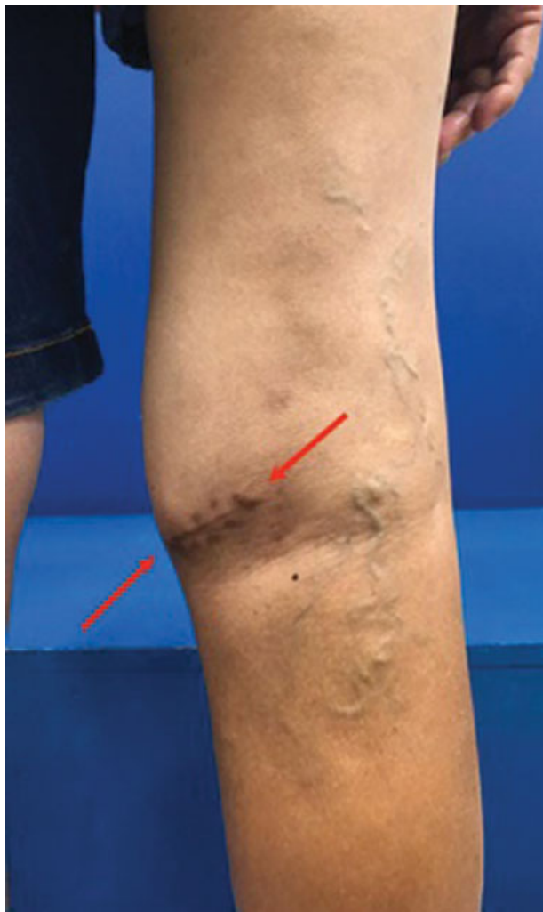
Fig. 2 Foto da mesma paciente da Figura 1 . Região posterior do joelho direito de uma paciente submetida a uma biópsia aberta com via de acesso inadequada. Observa-se cicatriz transversa que precisará ser ressecada por completo. O fechamento de pele poderá ser comprometido.

dos pulmões, o PET-CT muda o estadiamento quanto detecta metástases de diagnóstico duvidoso dentro ou fora dos pulmões. Além disso, o valor do standard uptake value (SUVmax) demonstrado no PET-CT pode prever não só a atividade biológica, como também o grau do tumor e por isso tornou-se um fator prognóstico útil na análise de sobrevivência de pacientes com SPM. O PET-CT também possui importante papel na avaliação da resposta à quimioterapia e no planejamento do volume da radioterapia. Como permite a avaliação prévia da agressividade do tumor, o PET-CT pode direcionar a realização de ressecções mais agressivas com margens adequadas e, por outro lado, pode evitar a realização de biópsias desnecessárias. 3,11,26