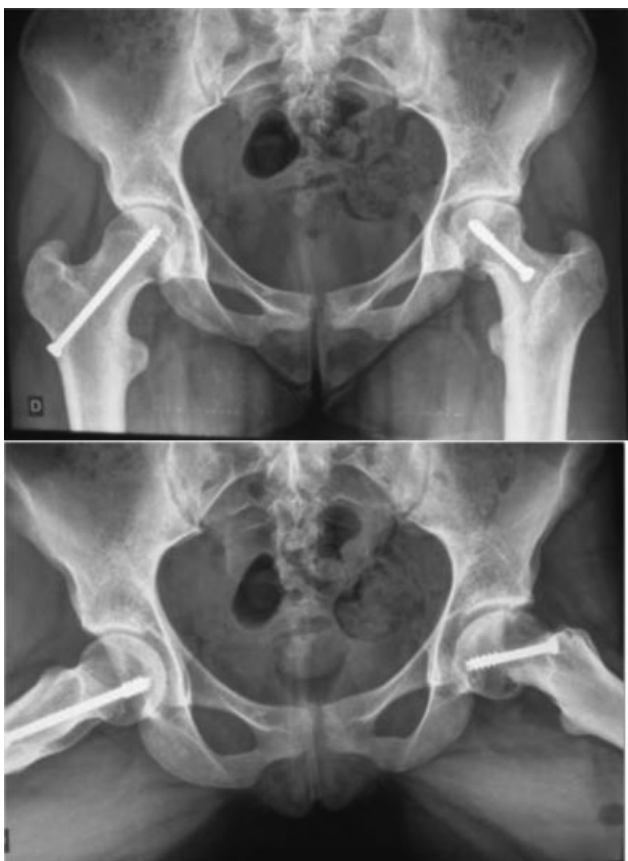
Fig. 4 Radiografia em incidência anteroposterior (acima) e de perfil de Lauenstein (abaixo) de bacia no pós-operatório evidenciando a correção da deformidade.

A anamnese, o exame físico e as radiografias foram compatíveis com IFA tipo came, secundário ao quadro de epifisiólise. Devido ao quadro algíco sintomático associado a bloqueio articular, o tratamento preconizado foi a osteocondroplastia por via artroscópica.