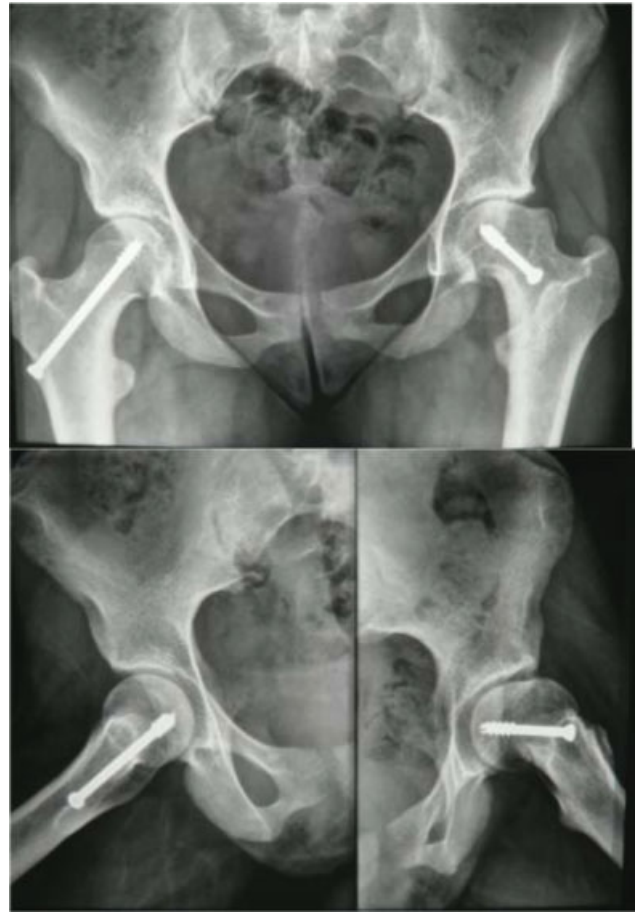
Fig. 1 Radiografias em incidência anteroposterior da bacia (acima) e de perfil de Dunn dos quadris (abaixo) evidenciando deformidade em região anterolateral do colo femoral esquerdo, compatível com impacto tipo came.

Ao exame físico, a paciente apresentava limitação importante da rotação interna do quadril esquerdo associada a quadro álgico durante a manobra. Foi evidenciado sinal de Drennan à esquerda durante o exame. A paciente não apresentava alterações neurovasculares nos membros inferiores, e tinha a força muscular preservada neles.