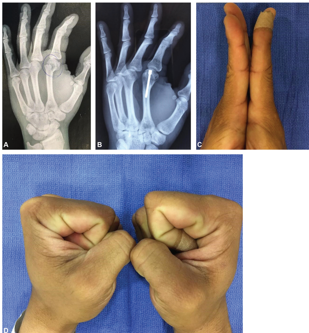
Fig. 2 A) Fratura do colo do segundo metacarpo; B) Radiografia pós-operatória tardia; C) Mínimo lag extensor; D) Leve déficit de flexão da articulação metacarpofalangeana.

todos os pacientes nessa série de 21 casos apresentados e mostrou ser uma excelente opção minimamente invasiva para o tratamento destas fraturas na mão.