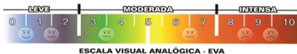
Fig. 2 Escala Visual Analógica da dor.

O projeto foi submetido ao Comitê de Ética em Pesquisa (CEP) da instituição, com o número de Certificado de Apresentação para Apreciação Ética – CAAE: 50651315.8.0000.0007, e recebeu o parecer substanciado com o número 1.774.789 em 13 de outubro de 2016, e foi também aprovado no Clinical Trials, com o registro RBR – 7PCKQT. Todos os pacientes que porventura concordassem participar da pesquisa assinavam o TCLE.