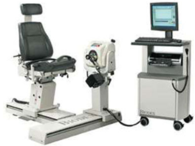
Fig. 2 Dinamômetro Biodex 3 System Pro .

O teste isocinético é caracterizado pela avaliação da força muscular em uma velocidade constante e prefixada. A avaliação isocinética foi realizada através do dinamômetro Biodex 3 System Pro (Biodex Medical Systems, Inc., Shirley, Nova York, EUA) (► Figura 2 ). Os pacientes foram posicionados na cadeira do dinamômetro com o ombro em 45° de abdução (plano da escápula), e cotovelo em 90° de flexão com antebraço neutro. O arco de movimento foi fixado em 90° (45° RM e 45° RL) de acordo com a metodologia de Davies,