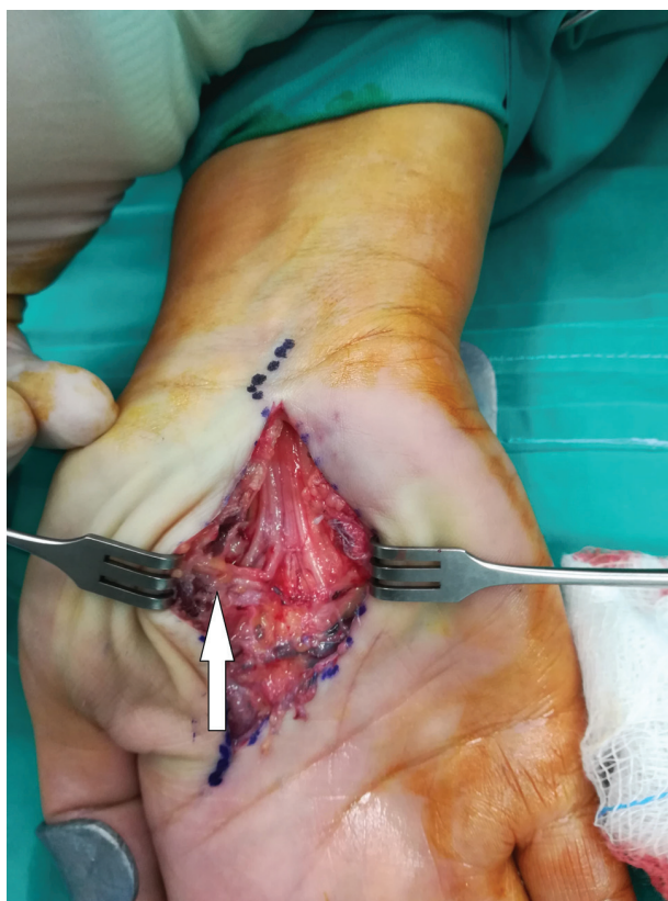
Fig. 5 Vista da palma após a excisão do lipoma. A seta branca aponta o ramo motor recorrente do nervo mediano.