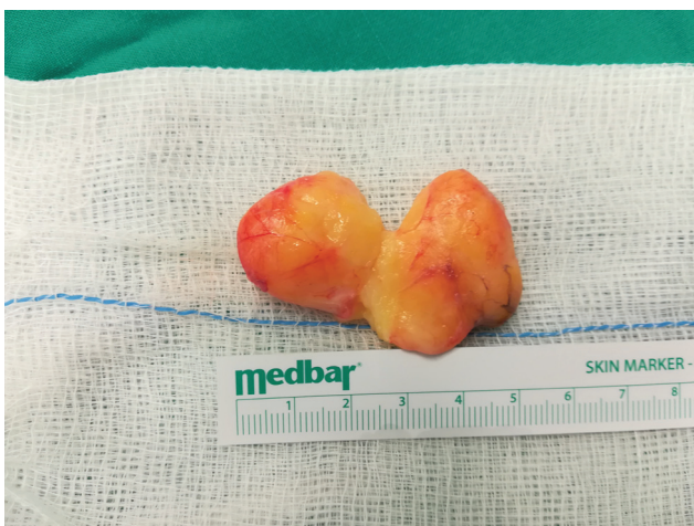
Fig. 4 Lipoma excisado. O tumor teve que ser dissecado em duas partes para evitar lesão do ramo motor do nervo mediano. As duas peças foram aproximadas para esta foto.

Vários casos de compressão do nervo mediano foram relatados na literatura, simulando a síndrome do túnel do carpo, 1,2,5,6 mas há pouquíssimas descrições de comprometimento do movimento do polegar por compressão do ramo motor do nervo mediano. 9 Nosso caso apresentava disfunção da musculatura tênar, comprovada por estudos de EMG, além de formigamento nos dedos por neuropatia do nervo mediano, que foi provocada pela compressão do lipoma. A maioria dos lipomas é superficial e pode comprimir as estruturas palmares acima, enquanto os lipomas profundos