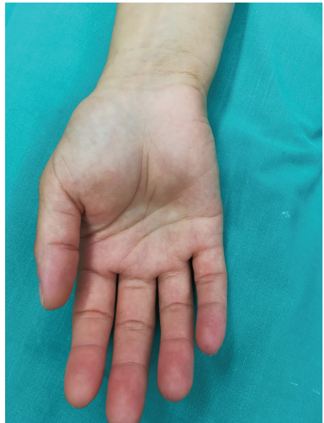
Fig. 1 Imagem clínica da palma direita da paciente, mostrando uma massa de tecido mole nas áreas tenar e hipotenar.

É amplamente aceito que tumores com tamanho superior a 5 cm são considerados lipomas gigantes, 1,2,4 com maior