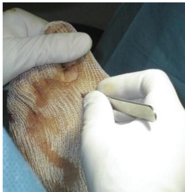
Fig. 1 Liberação percutânea do tendão da adutora.

teriormente, a cabeça metatarsal pode ser deslocada mais de 75% do diâmetro do primeiro metatarso, se necessário, permitindo correções de AIM graves. É uma osteotomia completa, e deve ser estabilizada com fio K intramedular. Controle a posição com fluoroscópio em vistas laterais e anteroposteriores.