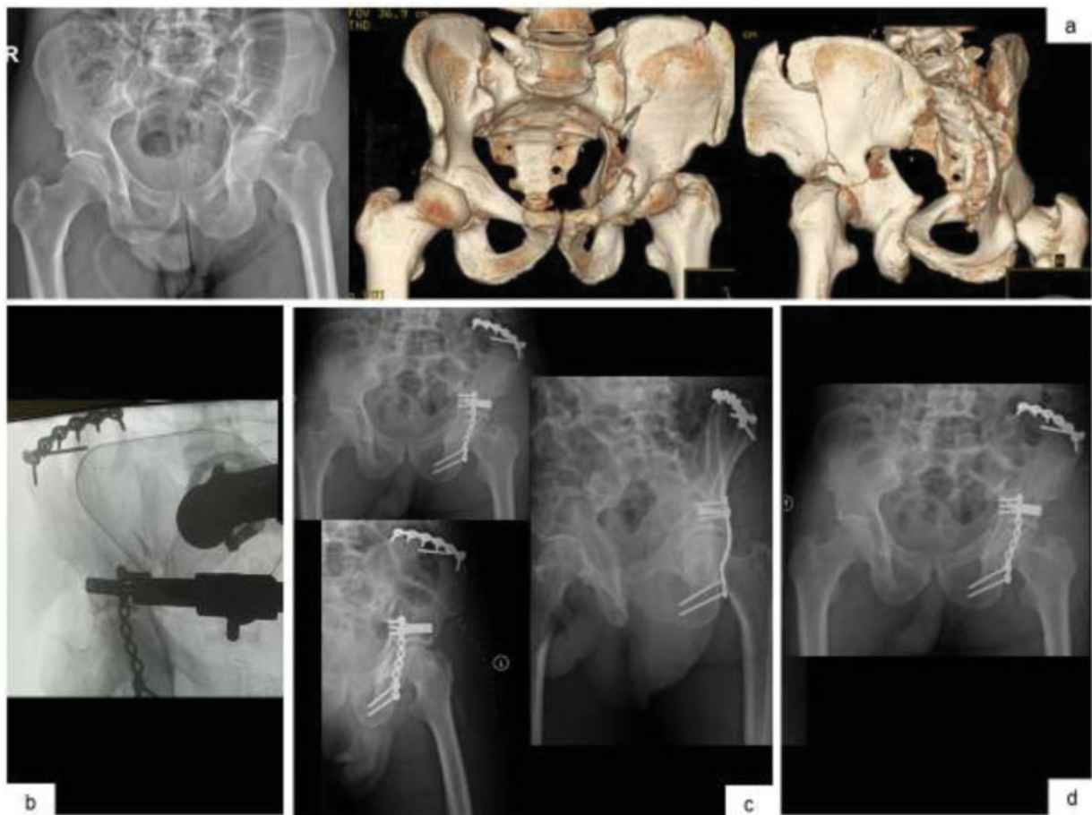
Fig. 3 Imagens de radiografia anteroposterior da bacia e imagens de TAC 3D para melhor caracterização da fratura de duas colunas do acetábulo esquerdo com extensão alta para o ilíaco (a) Imagem de controle intraoperatório (b) Controle radiológico nas incidências anteroposterior da bacia, alar e obturadora da anca esquerda no pós-operatório imediato (c) Radiografia anteroposterior da bacia ao 3º mês (d).

Kocher-Langenbeck combinada com abordagem da crista ilíaca. Com 7 meses de evolução, o paciente encontra-se a fazer marcha autônoma e sem dores, com um Harris Hip Score de 91 pontos (→ Fig. 3 ).