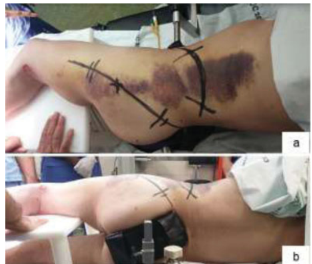
Fig. 4 Posicionamento do paciente em decúbito lateral e marcação prévia das incisões (a) Vista posterior do posicionamento, sendo neste plano que entra o intensificador de imagem (b).

a → Fig. 5 é representativa da sequência sugerida de redução e fixação. Na opinião dos autores, as principais vantagens desta opção são: cirurgia extrapélvica, realizada em um único tempo cirúrgico e posicionamento, sem um potencial de