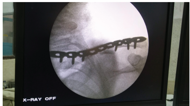
Fig. 4 Imagem intraoperatória do braço em C do mesmo paciente.

Todos os pacientes foram estimulados a mover o cotovelo, punho e dedos, desde o primeiro dia do pós-operatório, sendo aconselhados a apoiar o membro superior na tipoia do braço, pelo período de seis semanas com movimentos pendulares suaves, mantendo o braço dentro da tipoia. Todas as suturas foram removidas no 14º dia do pós-operatório, tendo sido descartada a tipoia na sexta semana do pós-operatório, então sendo estimulada a mobilização ativa do ombro. Durante o período de acompanhamento, foram realizadas avaliações clínicas e radiológicas, nas 6ª, 12ª e 18ª semanas e nos 6º e 8º meses após a cirurgia. Os resultados clínicos foram avaliados usando o escore de ombro de Constant-Murley (CSS) e também o escore de incapacidade de braço, ombro e mão (DASH). 24,25 A consolidação da fratura foi considerada na presença de calo ósseo em ponte no local da fratura, também foram medidas diferenças no comprimento da clavícula com lados contralaterais ílesos. O comprimento clavicular foi medido da extremidade lateral até a