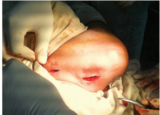
Fig. 2 Duas pequenas incisões nos lados medial e lateral da fratura da clavícula.

nos lados medial e lateral da placa. O braço em C foi utilizado para visualizar as imagens no período intra-operatório em neutro, 30 graus caudal e 30 graus cranial, a fim de confirmar a redução e a colocação das placas. A fixação definitiva foi feita com parafusos corticais de 3,5 mm em ambos os lados da fratura e os parafusos de cabeça bloqueada (LHS) foram usados para completar a fixação (► Fig. 4 ). Os ferimentos foram fechados em camadas.