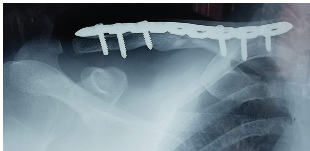
Fig. 5 Boa consolidação foi observada após 6 meses.

Houve um total de 17 casos tratados com a técnica MIPO. Havia 11 (64,7%) pacientes do sexo masculino e 6 (35,29%) pacientes do sexo feminino, com média de idade de 39,05 \pm 10,76 anos (variação de 22 a 57 anos). As causas das fraturas foram: acidentes de trânsito (ATR) em oito casos, queda de altura em cinco casos e agressão física em quatro casos. O tempo médio de acompanhamento neste estudo foi de 10,41 \pm 1,75 meses (variação, 8 a 14). Todas as fraturas foram consolidadas no tempo médio de 15,35 \pm 3,08 semanas (variação, 12 a 20 semanas) (→Fig. 5). O tempo cirúrgico médio foi de 98,11 \pm 13,83 minutos (variação, 70 a 130), sendo que a permanência hospitalar média foi de 4,7 \pm 1,12 dias (variação de 3 a 7). A pontuação média da escala Constant-Murley foi de 74,82 \pm 6,36 (variação de 66 a 90) no 4° mês do pós-operatório e de 92,35 \pm 5,48 (variação de 85 a 100) no 8° mês do pós-operatório, o que foi considerado estatisticamente significativo com p < 0,05 . A pontuação média da escala DASH foi de 9,94 \pm 1,55 (variação de 8 a 14) no 4° mês do pós-operatório e de 5,29 \pm 1,85 (variação de 4 a 9) na 8ª semana do pós-operatório, o que foi estatisticamente significativo com p < 0,05 . A diferença média do comprimento clavicular foi de 2,23 \pm 1,39 mm (variação, 0–5 mm), porém, foi encontrado