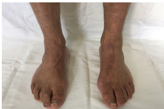
Fig. 5 Aspecto clínico do acompanhamento após 43 meses da excisão do tumor. Não havia sinais de recorrência da massa na região dorsal do pé esquerdo.

O PE e o HP compartilham a origem histológica, as características celulares semelhantes às células tumorais monomórficas, a diferenciação ductal e a necrose. 7 No entanto, clinicamente, apresentam aspectos diferentes. Frequentemente, o PE é uma lesão sólida não cística, com aspectos nodulares, granulares e papilados de várias cores. O HP se apresenta como um tumor sólido e cístico localizado