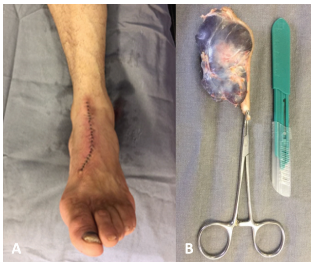
Fig. 3 (A) Abordagem dorsal e (B) tumor totalmente excisado. Após a ressecção, observou-se o aspecto cístico da lesão.

A coexistência de PE e HP é rara, restrita a poucos relatos de casos no joelho e nas partes superior e inferior das costas. 8,9 Porém, eles têm demonstrado evolução clínica satisfatória após a excisão completa do tumor. Não foi observada