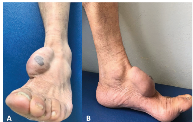
Fig. 1 (A) Vista clínica frontal e (B) lateral de grande massa sobre o médio-pé, com bordas bem definidas, consistência fibroelástica e não aderente ao tecido mole circundante. O nódulo preto ligeiramente elevado na parte superior é a porção PE, e a maior parte do tumor cístico é a porção HP.

O exame histopatológico confirmou que o tumor era uma NP, consistindo de ambos os componentes da derme