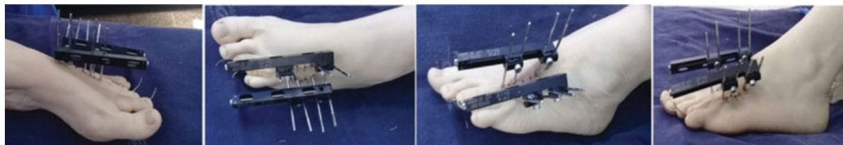
Fig. 4 Pós-operatório de paciente com deformidade em 3° e 4° metatarsos do pé esquerdo submetidos a alongamento ósseo com fixador externo monolateral.