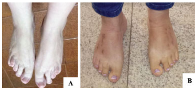
Fig. 5 Aspecto clínico pré-operatório (A) e pós-operatório (B) de paciente com braquimetatarsia bilateral em 3° e 4° metatarsos submetidos a distração osteogênica com uso de fixador monolateral.

A distração osteogênica tem como desvantagem a necessidade do ajuste regular do fixador externo para alongamento, a possibilidade de formação óssea insuficiente e o risco de infecção local. Para estímulo da formação óssea adequada, uma osteotomia cuidadosa deve ser realizada com o mínimo de dano ao tecido mole e vascular. 11,18