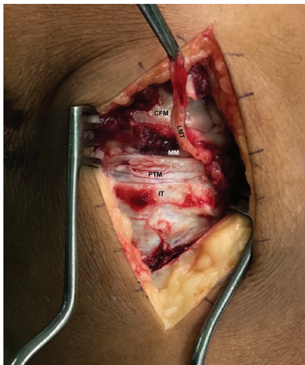
Fig. 1 Ligamento meniscotibial medial. Abreviaturas: CFM, côndilo femoral medial; LMT, ligamento meniscotibial; PTM, platô tibial medial; MM, menisco medial; IT, inserção tibial do LMT medial.

artigos que descreviam os aspectos anatômicos dos LMTs (►Tabela 1) 2-4,8-12 para leitura na íntegra (►Fig. 2).