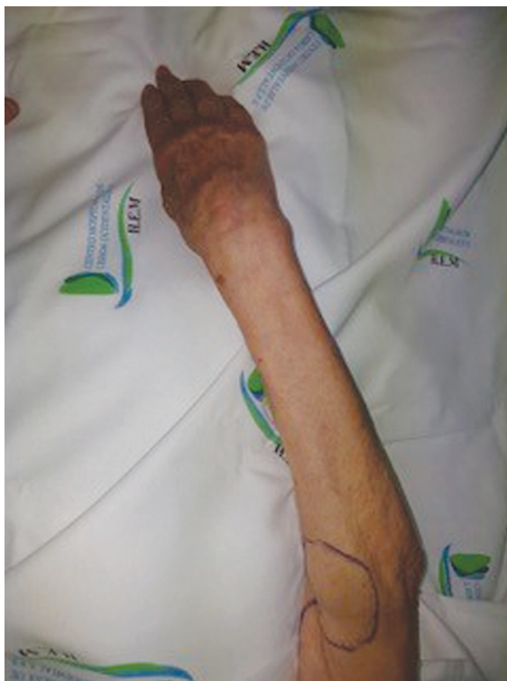
Fig. 10 Cicatriz postoperatoria.