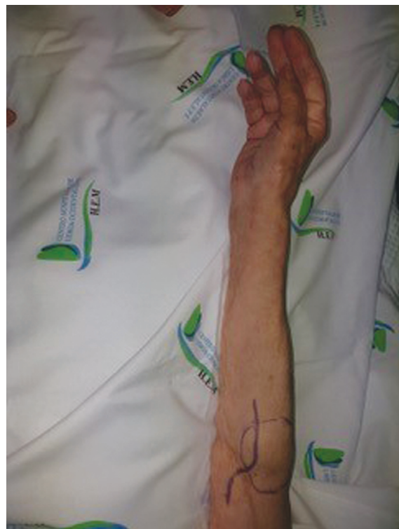
Fig. 11 Comparación posoperatoria con la mano izquierda.