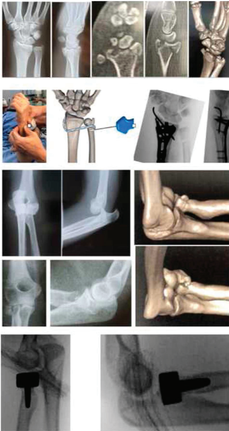
Fig. 2 Aspectos preoperatorios e intraoperatorios: Fractura luxación de codo asociada a fractura articular de radio distal e inestabilidad longitudinal - tratamiento quirúrgico con artroplastia de cabeza radial, osteosíntesis de radio distal con placa volar bloqueada y reconstrucción de la parte distal de la membrana interósea con injerto de tendón del bíceps distal.