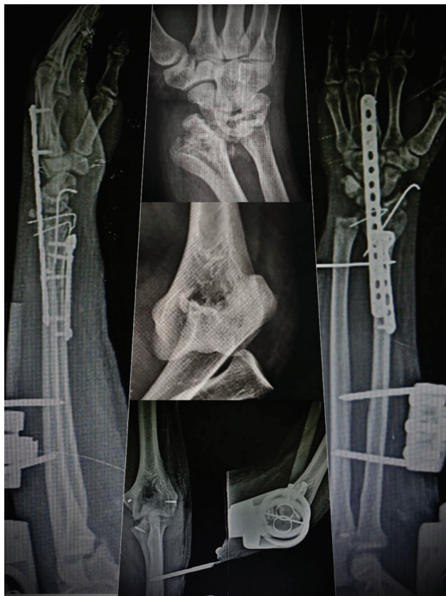
Fig. 3 Aspectos radiográficos pre, intra y postoperatorios: Luxación de codo asociada a fractura de radio distal articular e inestabilidad longitudinal - tratamiento quirúrgico con reparación de ligamentos medial, anterior y lateral del codo con anclajes de sutura, fijador externo dinámico de codo, osteosíntesis de radio distal con bloqueo volar y placa de expansión y reconstrucción de la parte distal de la membrana interósea con injerto de tendón del bíceps distal.

ortesis dinámicas a partir de la tercera semana en planta. Esta evaluación debe ser individualizada. Se animó a los pacientes a realizar actividades que evitaran la sobrecarga o los cambios en la función. 12