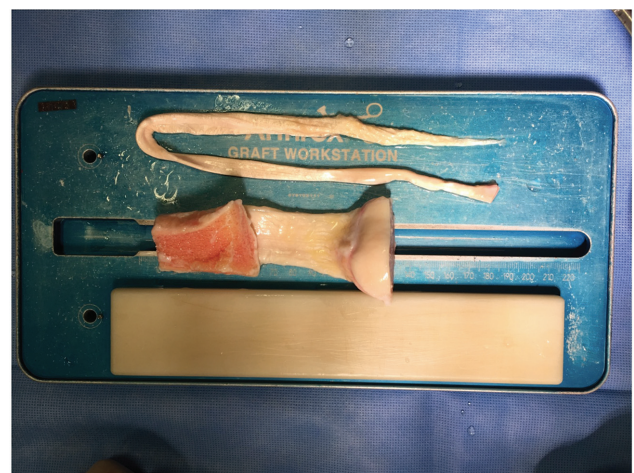
Fig. 1 Foto de aloenxertos prontos para serem preparados. Observam-se enxerto com parte óssea (Pateelar) e sem partes ósseas (Tibial Posterior).

O estudo de coorte prospectivo realizado por Kaeding et al. 13 avaliou o número de variáveis para determinar preditores da ruptura do enxerto nos 2 anos após a reconstrução. Uso de aloenxerto e idade jovem aumentaram