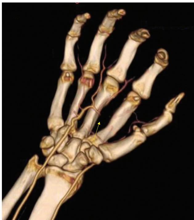
Fig. 3 Imagen de angiografía tridimensional (3D): arco palmar superficial.

neurovascular mediante la disección por planos, y se ligaron los vasos nutricios sobre el primer/segundo radio y los vasos del paquete colateral cubital del segundo dedo utilizando hemoclips, respetando los nervios colaterales. Tras la ligadura, se resecó el pseudoaneurisma. Pese al buen estado de la región palmar tras la misma, y sin evidenciar tejidos patológicos perilesionales, se decidió enviar la muestra a Anatomía Patológica.