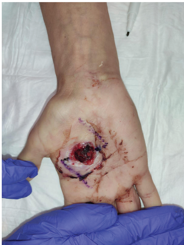
Fig. 1 Imagen del pseudoaneurisma previa al tratamiento quirúrgico. Diseño de incisión en Z.

En el quirófano, se utilizó anestesia locorregional, junto con una isquemia por elevación. Se ampliaron los bordes de la herida mediante una incisión en Z, y se realizó un desbridamiento de los esfacelos de la misma. Fueron localizados el arco palmar superficial y el paquete