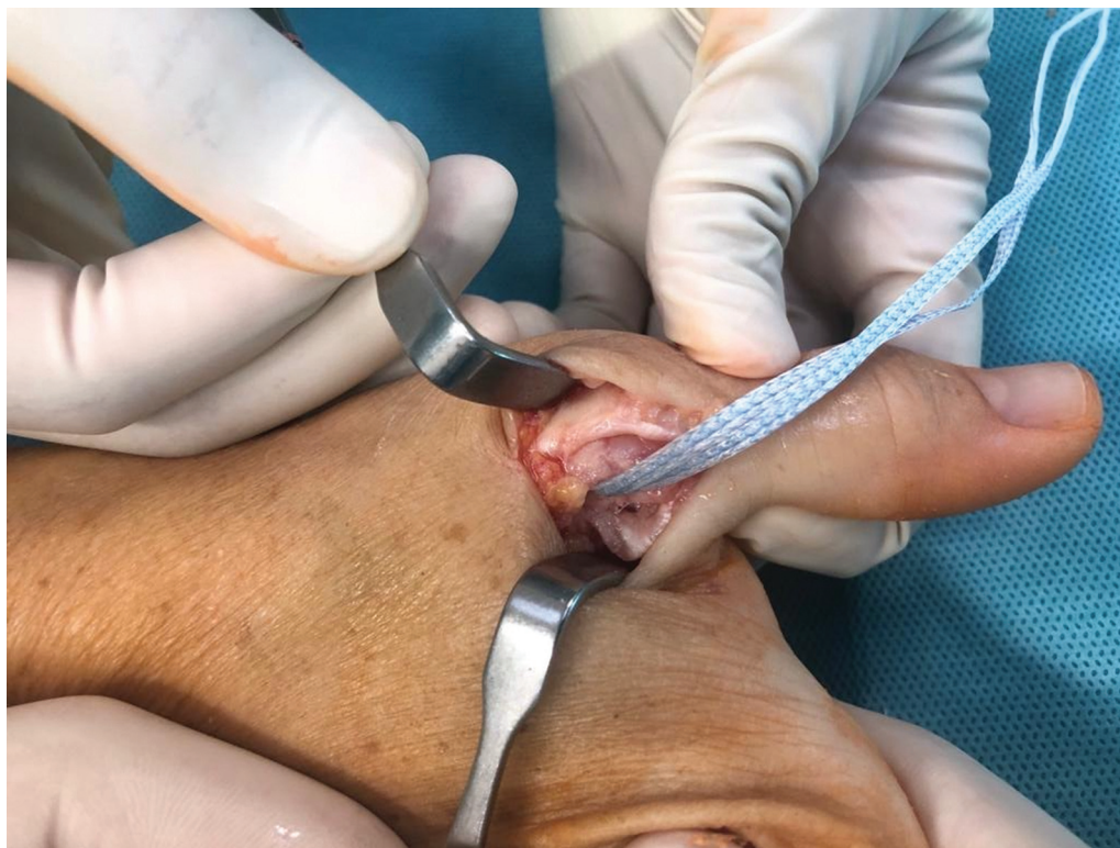
Fig. 2 Carga de FiberTape con un anclaje DX SwiveLock de 3,5 mm en el orificio del cuello metacarpiano.

Se perfora sobre las agujas guías utilizando una broca canulada de 3,0 mm, 1 cm dentro del hueso, según lo limitado por el tope de profundidad. Luego se cargó la zona central de un FiberTape de 2,0 mm en un anclaje DX SwiveLock (Arthrex, Inc.) de 3,5 mm sin nudos, completamente roscado, con punta bifurcada, y luego se insertó en el orificio del MTC (► Fig. 2 ). Después, se lleva distalmente la cinta volar de FiberTape, se cargó en el ojal bifurcado de un segundo anclaje DX SwiveLock de 3,5 mm, y