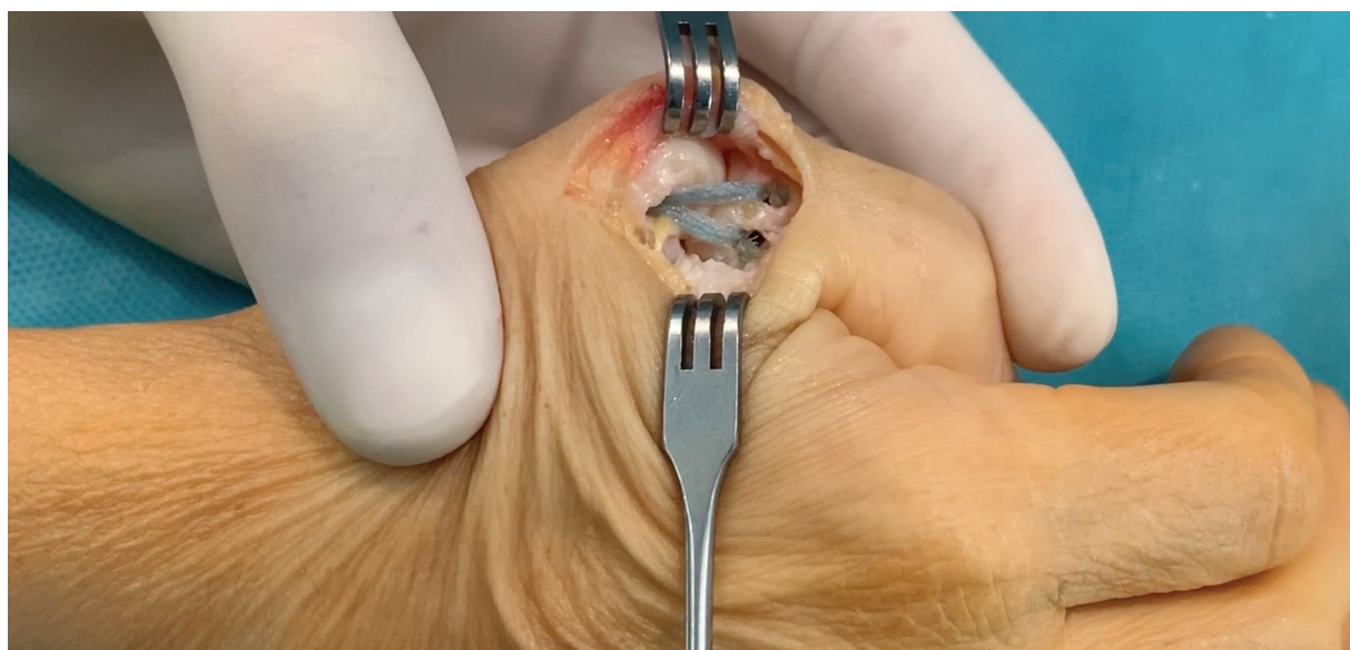
Fig. 3 Configuración triangular final del FiberTape con anclaje DX SwiveLock de 3,5 mm.

se insertó en el orificio de volar en la base de la falange proximal, mientras se mantenía la articulación reducida en posición neutra para evitar una tensión excesiva en la reparación. Finalmente, se lleva distalmente la cinta dorsal de FiberTape, se cargó en el ojal bifurcado de un tercer anclaje de sutura de 3,5 mm, y se insertó en el orificio dorsal en la falange proximal, mientras se mantenía la AMCF a 30 grados de flexión para evitar tensión excesiva en la reparación (► Fig. 3 ). Colocar pequeñas pinzas curvas debajo del