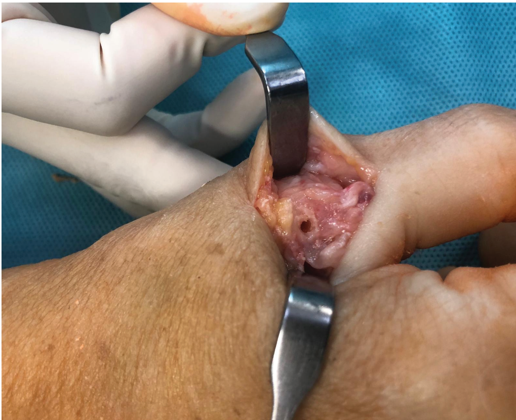
Fig. 1 Punto de fijación proximal en el cuello metacarpiano en la posición de las 9 en punto.

Se colocaron 3 agujas guía de 1,35 mm. Dos de las agujas de Kirschner se colocaron en el lado proximal cubital de la falange en una orientación convergente, donde se inserta el LCC. Este método garantiza un espacio suficiente entre cada orificio después de la perforación y evita complicaciones intraoperatorias, como fracturas. La tercera aguja de Kirschner se colocó proximal al origen del LCC, 6 a 8 mm de la AMCF, en la parte dorso-cubital de la cabeza del metacarpiano (MTC).