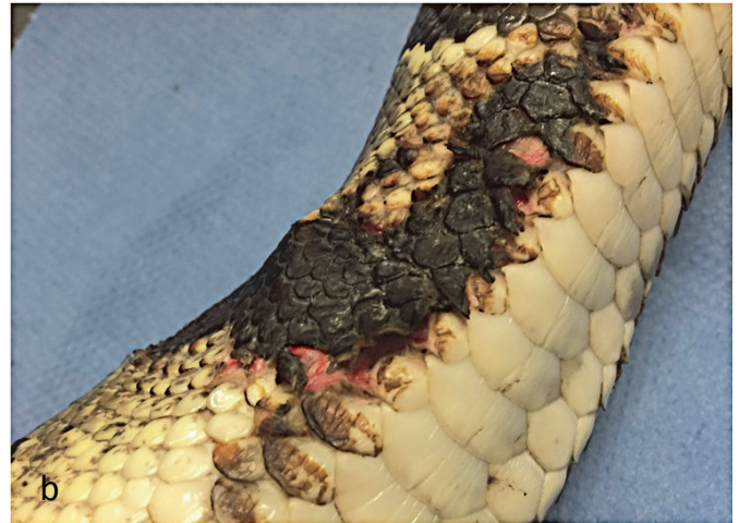
Fig. 1 Clinical presentation of the ball python. a) Sharply demarcated, necrotic skin area at the right flank in the middle of the body. b) Partially detaching eschar at the thorax revealing the underlying muscle layer.

Nach 7 Tagen war Granulationsgewebe im Wundrandbereich sichtbar und bei der zytologischen Untersuchung fanden sich keine Bakterien mehr. Nach 14 Tagen waren die nekrotischen Areale in ihrer Fläche um etwa 50% reduziert, ohne dass weitere Stellen mit Gewebeerlust auftraten. Die CAPP-Therapie wurde nach weiteren 2 Wochen mit jeweils einmaliger Anwendung beendet. Zwei Monate später waren alle Hautwunden komplett zugeheilt und hinterließen lediglich deutliches Narbengewebe, das im weiteren Verlauf von 12 Monaten zu keinen Häutungsproblemen führte (▶ Abb. 3).