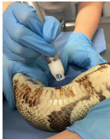
Abb. 2 Durchführung der Kaltplasmatherapie (nekrotisches Hautareal aufgrund des Fotografiwinkels nicht sichtbar). Jeder Quadratzentimeter wurde über 15 Sekunden behandelt.

Bislang gibt es nur wenige pharmakokinetische Studien bei Reptilien und die Dosierung von Antibiotika erfolgt oft empirisch oder basierend auf anekdotischen Informationen (23). Trotz limitierter pharmakokinetischer Daten werden Fluorchinolone regelmäßig zur Behandlung bakterieller Infektionen bei Schlangen eingesetzt (40). Diese sind effektiv gegen die meisten bei Reptilien vorkommenden aeroben Bakterienstämme und verteilen sich gut