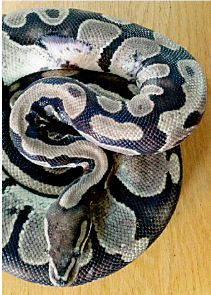
Abb. 3 Zustand des Patienten nach 4 Monaten. Obwohl Narbengewebe an den ehemaligen Wundstellen verblieb, zeigte die Schlange keine Anzeichen für Dysecdysis.