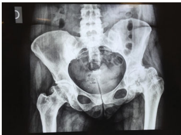
Fig. 1 Radiografia em anteroposterior da bacia – coxartrose bilateral, demonstra encurtamento de membro inferior esquerdo.

A paciente foi submetida a raquianestesia para analgesia com codeína, sem bloqueio motor. Posicionada em decúbito lateral direito, os eletrodos de monitoração eletroneurofi-