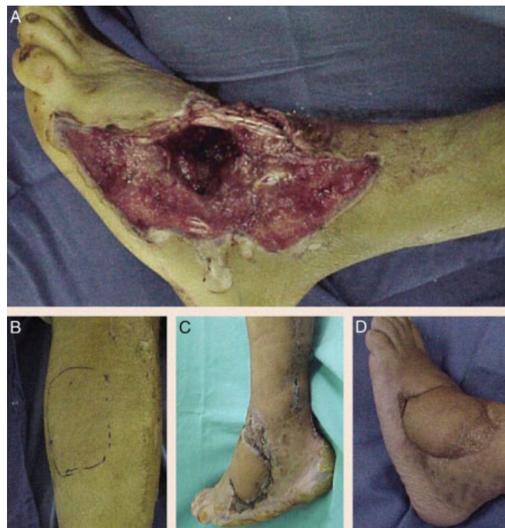
Fig. 2 Trauma por esmagamento. A, lesão extensa em dorso do pé com área crítica de 8 \times 8 cm; B, Área doadora; C, Área receptora após cobertura de retalho fasciocutâneo sural; D, pós-operatório tardio.