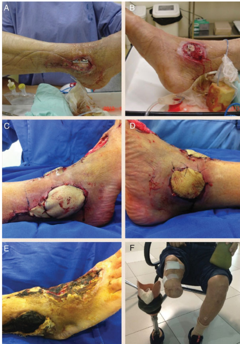
Fig. 3 Fratura exposta maléolo lateral (A) e medial (B). Infecção na ferida operatória bilateral levou à falência de tecidos de cobertura. Feito retalho fasciocutâneo sural de fluxo reverso para maléolo lateral (C) e retalho pedioso para maléolo medial (D). Necrose total de ambos os retalhos (E). Evolução para amputação (F).

úlceras crônicas, lesões traumáticas (principalmente secundárias a fraturas expostas), ressecções oncológicas, lesões localizadas na face posterior do calcânar e do tendão de Aquiles, na face lateral e anterior do tornozelo, no dorso do pé, na face lateral do retopé e no terço inferior da perna. Outras indicações, como cobertura total do calcânar, face medial do terço distal da perna, são consideradas relativas devido à distância ser diminuta em relação ao ponto de rotação, o que pode afetar o pedículo vascular ao tentar atingir essas regiões, pode comprometer o retalho. 1-3,6