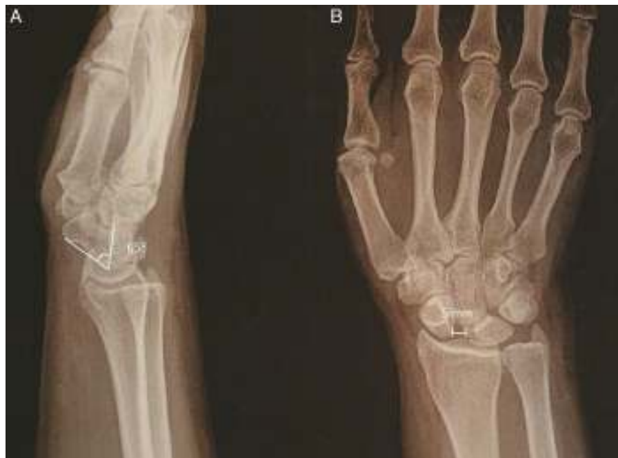
Figura 4 Radiografía preoperatoria de la inestabilidad EL estática. A) La proyección lateral muestra un ángulo escafolunar de 65°. B) La proyección anteroposterior muestra una separación EL de 5 mm.

DASH: Disabilities of Arm Shoulder and Hand ; Dcho.: derecho; F: fuerza; Izqdo.: izquierdo; kg: kilogramos.