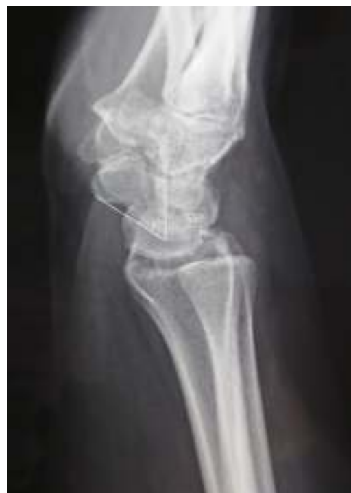
Figura 6 Radiografía lateral al final del seguimiento que muestra un ángulo EL de 55°.

Los injertos hueso-tendón-hueso 4 son una alternativa a la capsulodesis cuando no hay mal alineamiento del escafoides, ya que la reconstrucción aislada de la porción dorsal del ligamento EL no soluciona el problema de la malrotación multiplanar del carpo 3 . Utilizando un autoinjerto hueso-tendón-hueso de la segunda articulación carpometacarpina —como describe Cuénod 18 — Kalb 19 interviene 16 pacientes de los cuales 12 tienen inestabilidad estática; después de