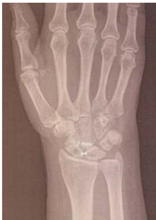
Figura 5 Radiografía postoperatoria al final del seguimiento; en la radiografía anteroposterior se aprecia una separación EL de 2 mm.

(°): grados; Dcho.: derecho; Izqdo.: izquierdo; mm: milímetros; Postop.: postoperatorio; Preop.: preoperatorio.