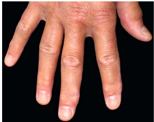
► Abb. 2 Erythematöse Papeln an den Streckseiten der Finger.