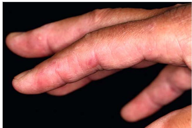
► Abb. 3 An den Fingerseitenkanten bis zu 6 mm durchmessende erythematöse Papeln.