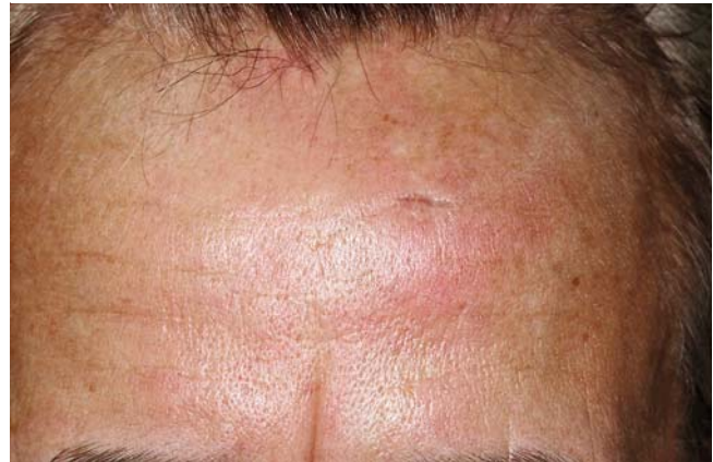
► Abb. 1 Stellenweise leicht infiltrierte Erytheme an der Stirn.

Neben der kutanen Manifestation, der interstitiellen Lungenerkrankung und der im Verlauf hypomyopathischen Komponente fanden sich keine weiteren Manifestationen der Dermatomyositis. Zum Ausschluss einer Neoplasie veranlassten wir weitere Untersuchungen wie CT-Abdomen, Gastro- und Koloskopie sowie eine gynäkologische Vorstellung, die jedoch sämtlich unauffällig waren.