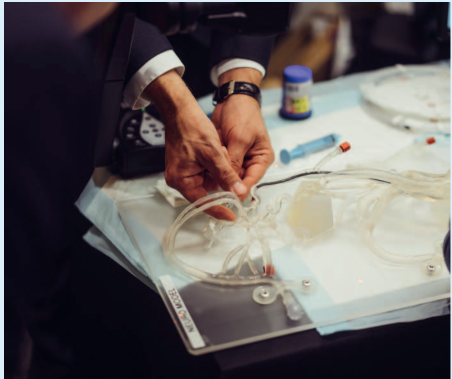
Echte Materialien anfassen, ausprobieren, mit Experten/Expertinnen diskutieren – ohne Einflussnahme der Industrie. (copyright: Christian Maegerlein).