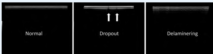
► Fig. 1 Eksempel på normal lineær transducer og derudover transducer med dropout (døde elementer) og transducer som er delamineret.

Fra oktober til november 2021 blev der udsendt en anonym national spørgeske-