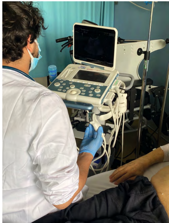
► Fig. 1 Medical Ultrasound (bedside) performed with a transportable device.

It is also worth reminding the ease of performing the examination directly in the ward for inpatients (► Fig. 1) or in the visit room for outpatients, avoiding the need to move beds or wheelchairs. This not only saves time and costs, but also eliminates