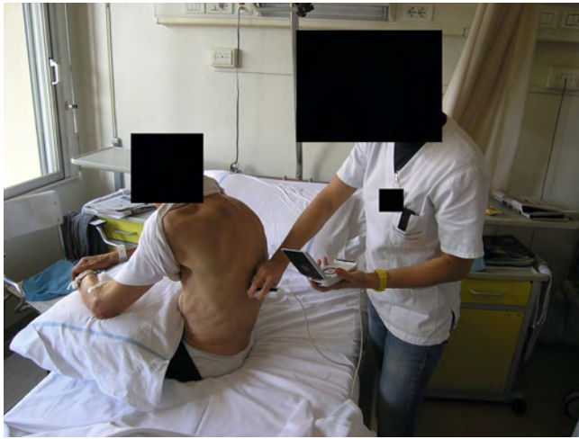
► Fig. 2 Medical ultrasound (bedside) with pocket-size device.

unit. This coincides with the definition of “clinical” ultrasound, where the meaning is precisely that of an examination carried out by someone who is regularly at the patient’s bedside. This is indeed reminded by the etymology of the word itself, as the etymology of “clinical” derives from the ancient Greek word meaning “bed,” making it synonymous with the current English term “bedside.”