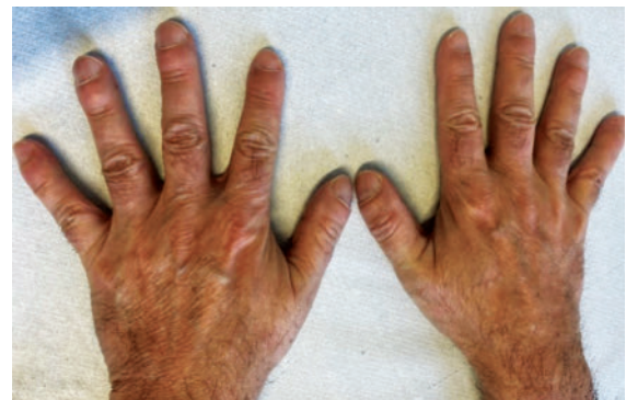
► Abb. 4 Typische skelettale Veränderungen bei CAPS.

Patienten mit schwerem CAPS können Skelettanomalien mit Knochen deformität aufweisen und an chronischer Polyarthritiden leiden (► Abb. 4 ). Mehrere Patienten mit CINCA/NOMID zeigen eine charakteristische Arthropathie