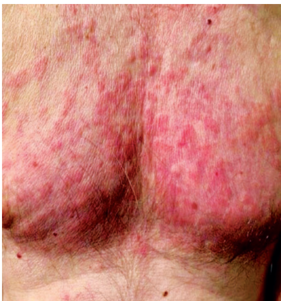
► Abb. 1 Neutrophile urtikarielle Dermatitis bei CAPS.

die auch als Risikoallele identifiziert wurden, können jedoch bei betroffenen Trägern zu einem AID-Phänotyp führen [2]. NLRP3 -Varianten unklarer Signifikanz (z. B. V198 M, R488K und Q703K) können sowohl typische CAPS-Symptome wie Urtikaria, Kopf- und Gelenkschmerzen als auch atypische Symptome wie gastrointestinale Symptome und hohes Fieber aufweisen [8]. Darüber hinaus können Q703K-Varianten auch mit Pharyngitis und oraler Aphthose assoziiert sein [9].