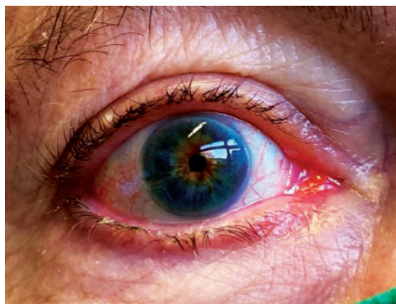
► Abb. 2 Typische Augenbeteiligung bei CAPS.

NLRP3 kodiert für das Protein Cryopyrin, das durch Mutationen verändert werden kann und dadurch eine wesentliche Rolle bei der Pathogenese von CAPS spielt. Cryopyrin gehört zur Familie der intrazellulären „NOD-ähnlichen Rezeptoren“ und kann einen Multiproteinkomplex namens NLRP3 -Inflammasom bilden [12]. Das NLRP3 -Inflammasom besteht aus spezifischen Adaptorproteinen wie dem Apoptose-assoziierten „Speck-like“-Protein (ASC), das eine Caspase-Rekrutierungsdomäne und mehrere Chaperonproteine enthält [13].