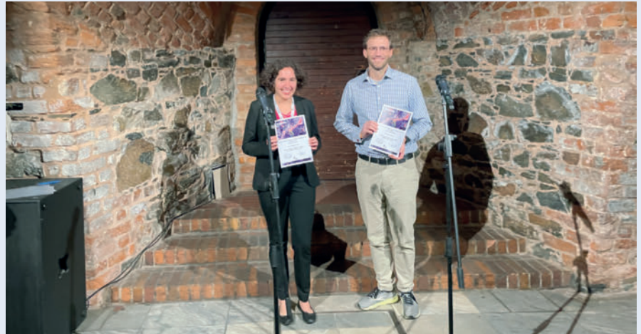
► Abb. 1 Preisträger*innen des Forschungspreises 2023.

Mit Hilfe von Einzelzellsequenzierung konnten wir aktivierte T-Zellen und Gedächtnis-B-Zellen sowie Monozyten der Patient*innen untersuchen. Diese Zellen weisen eine ausgeprägte TGF- \beta -Antwort-Signatur auf. Darüber hinaus zeigen die Monozyten eine verminderte Fähigkeit zur Anti-