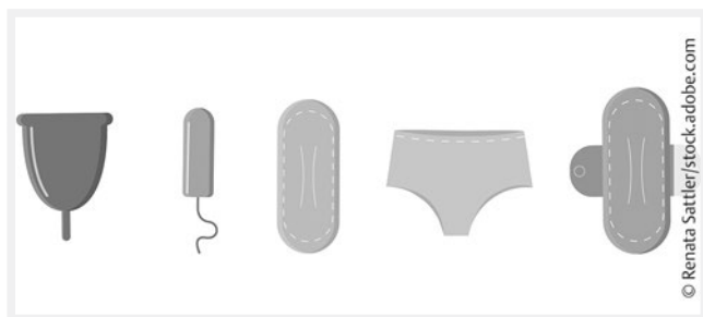
► Abb. 3 Illustration von Produkten der Monatshygiene: Menstruationstasse, Tampon, Binde, Periodenunterwäsche, Stoffbinde (von links nach rechts).

zur neuen Norm würde, könnte sich das Menstruationsstigma verstärken. Vor diesem Hintergrund divergierender Beurteilungen bedeutet Menstruationsautonomie , eigenständig eine informierte Entscheidung treffen und umsetzen zu können. Immer wieder werden beispielsweise bei Menschen mit Behinderungen Verletzungen der sexuellen und reproduktiven Selbstbestimmung beklagt, etwa wenn Frauen, die nicht sexuell aktiv sind, ohne informierte Einwilligung die Pille im Langzyklus verabreicht wird, um die Monatsblutung zu vermeiden und die Pflege zu erleichtern (vgl. Draths 2022).