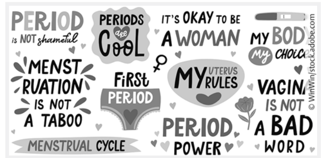
► Abb. 7 Stock-Bilder greifen in gefälligem Design Parolen aus dem Menstruationsaktivismus auf (Quelle: © WinWin/stock.adobe.com).

Diese und andere Strömungen im Menstruationsaktivismus verzeichnen deutliche Erfolge, die sich u. a. in der Anerkennung der Menstruationsgesundheit als zentrales Thema durch die WHO niederschlagen sowie in vielen nationalen politischen Veränderungen (z. B. Maßnahmen gegen Periodenarmut und für menstruationsfreundliche Arbeitsplätze). Dennoch werden einzelne Maßnahmen und Strömungen im Menstruationsaktivismus kritisch hinterfragt, etwa mit Blick auf unterschiedliche Problemlagen im globalen Norden und Süden (Winkler 2021). Der Menstruationsaktivismus mit seinem Diktum der Period Positivity weist zudem Verbindungen zu