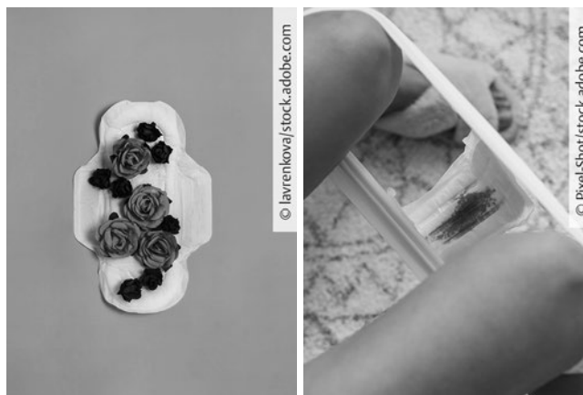
► Abb. 1 Visualisierungen der Menstruation in Stockfotos zwischen blumiger (links) und blutiger (rechts) Binde.

nämlich Weiblichkeit auf biologische Faktoren zu verkürzen, Beschwerden und Störungen rund um die Menstruation auszublenden, nicht menstruierende Frauen in ihrer Weiblichkeit abzuwerten sowie Menstruierende, die sich nicht als Frauen identifizieren, zu exkludieren. Das Thema Menstruation ist also nicht nur facettenreich, sondern auch spannungsgeladen angesichts konträrer Ansätze der Entstigmatisierung. Sichtbar sind solche Spannungen nicht nur in Wortbeiträgen, sondern auch in Bildbeiträgen zur Menstruation. Ein kurzer Blick in die führende Stockfoto-Datenbank 2 Adobe Stock genügt, um zu erkennen, dass die Menstruation heutzutage sowohl blumig als auch blutig dargestellt wird (siehe ► Abb. 1 ). Die Wahrnehmungen und Wirkungen unterschiedlicher Visualisierungen der Menstruation sind bislang kaum erforscht.