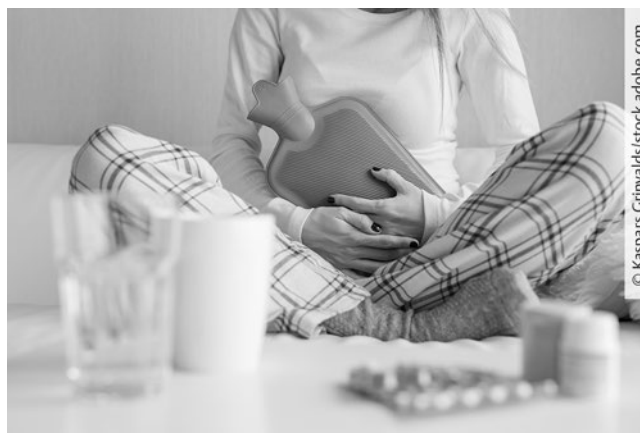
► Abb. 4 Medikalisierte Darstellung der Menstruation mit Fokus auf Schmerz.

Im Sinne der Menstruationsgesundheit ist es wichtig, keine unnötigen Ängste vor der Monatsblutung zu schüren und diese auch nicht pauschal zu pathologisieren, da sie ein normaler Bestandteil des Monatszyklus ist. So zeigte eine bevölkerungsrepräsentative Befragung in Deutschland unter Mädchen und Frauen im Alter von 14 bis 55 Jahren, dass die große Mehrheit von 76 % keine beeinträchtigenden Menstruationsbeschwerden angaben, während 20 % leichte und 4 % schwere Beeinträchtigungen berichteten (Häuser et al. 2014). Menstruationsbeschwerden hängen mit niedrigerem Einkommen, anderen körperlichen Symptomen und höherer Depressivität zusammen (Häuser et al. 2014). Etwa die Hälfte der betroffenen Personen hat ihre Menstruationsbeschwerden bereits bei ärztlichen Konsultationen angesprochen, wobei nur die Hälfte sich angemessen beraten fühlte (Plan International und WASH United