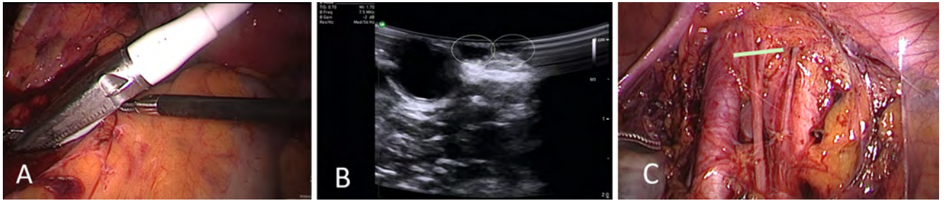
► Fig. 2 Laparoscopically guided sonography for visualization of the genitofemoral nerve before opening the retroperitoneum. A – Laparoscopic placement of the drop-in transducer in the area of the right psoas muscle to expose the right genitofemoral nerve; B – Sonographic image of a splitting right genitofemoral nerve; both branches are outlined in green in the figure; C – Anatomical correlation of the sonographic image after opening the right pelvic wall; a green bar marks the sonographic plane in the figure.