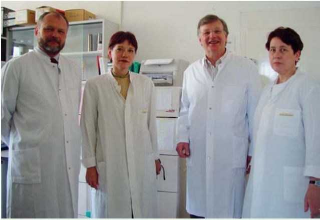
Abb. 5 Stavropol.

tung aus Deutschland enthält. Somit konnte das Projekt unter Zeitdruck am 20.12.2007 abgeschlossen werden.