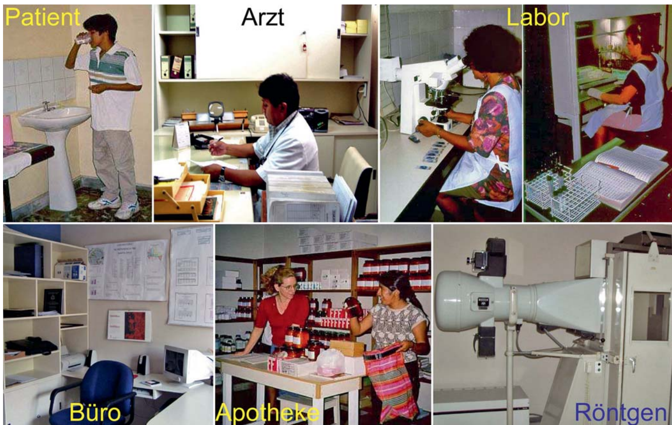
Abb. 2 Bolivien, Zentrum I – Einblicke.