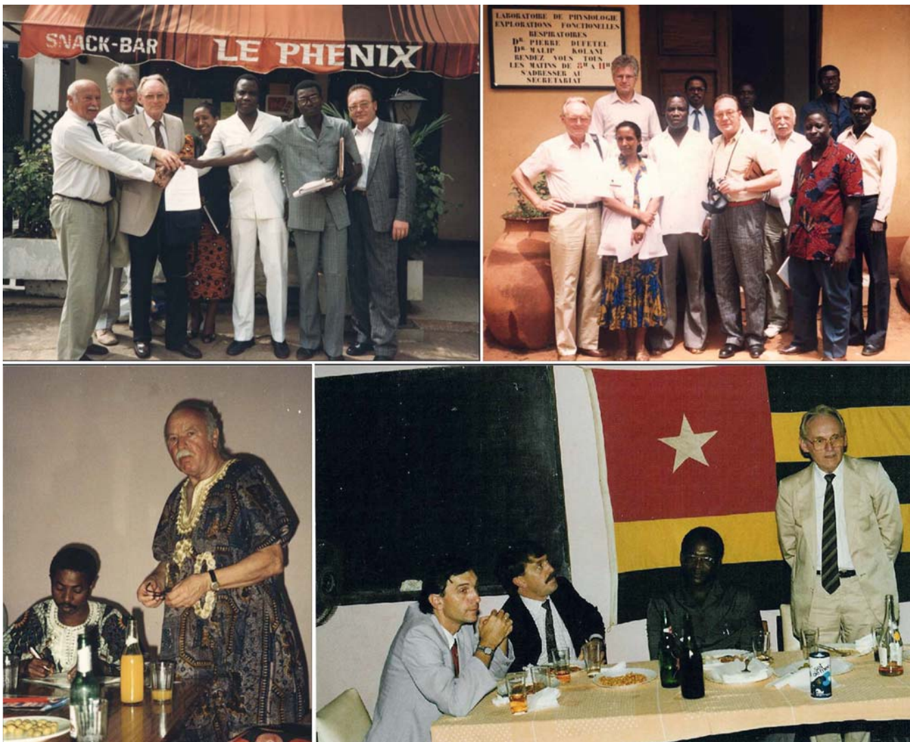
Abb. 4 Togo (1987–1998), Delegationen.

war. Trotzdem verlief das Projekt erfolgreich, bis einerseits zunehmende politische Unruhen, andererseits HIV-Infektionen, die anfangs von Regierungsseite „verboten“ waren, immer weiter um sich griffen und somit das Projekt sehr beeinträchtigten. Nach Beendigung der „Anschubfinanzierung“ durch das BMZ konnte das Kuratorium die finanziellen Belastungen nicht mehr weiter tragen. Die Einrichtungen wurden daher dem DAHW zur weiteren Nutzung übertragen.