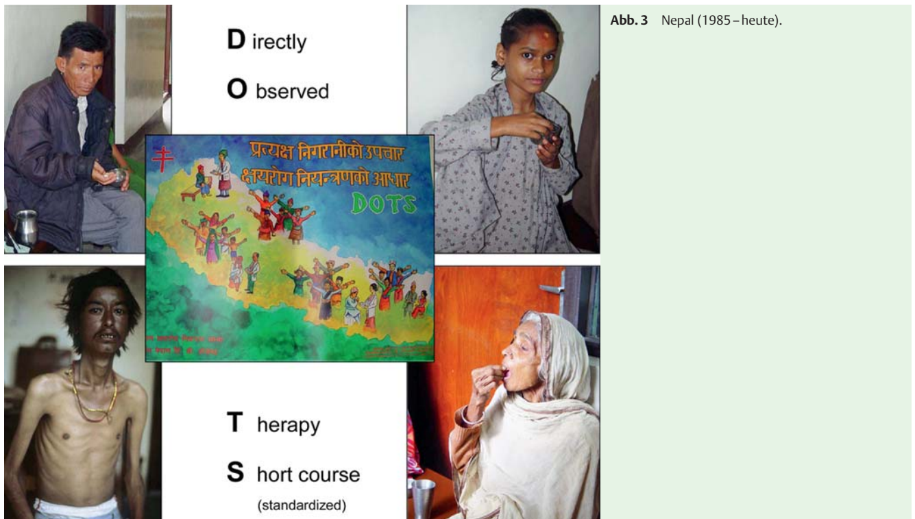
Abb. 3 Nepal (1985 – heute).

tungen und „Abstürzen“ der elektronisch gesteuerten Regelsysteme wie auch der Computer wurden mithilfe einer unterbrechungsfreien Stromversorgung mit 16 Auto-Batterien überbrückt. Dieses Beispiel zeigt, mit welchen Schwierigkeiten man im Land immer wieder konfrontiert wurde.