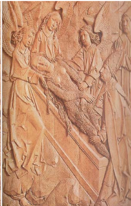
Abb. 2 Münnerstädter Altar von Tilman Riemenschneider, rechter Flügel: Die am ganzen Körper dicht behaarte Magdalena empfängt vom Bischof die letzte Kommunion und Grablegung.