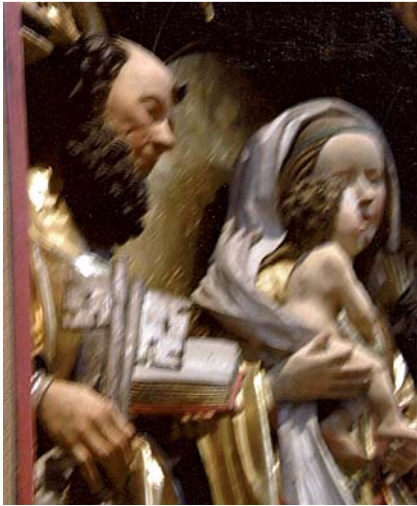
Abb. 4 Gotische Basilika Tiefenbronn, Petrus mit cholerischer Stirnlocke und Schlüssel betrachtet die Muttergottes mit Kind (Foto: H. & W. Sundermeyer).

und inneren Wandel überwundenen, lasterhaften Lebensweges. Dies erfuhr im 15. Jahrhundert einen Höhepunkt der Darstellung und wirkt, wesentlich diskreter, wohl auch noch weiter. Die Haartracht in vielfältiger Form und Aufmachung hat aber neuerdings an Bedeutung und Symbolwert enorm zugewonnen und treibt mitunter echte Blüten.