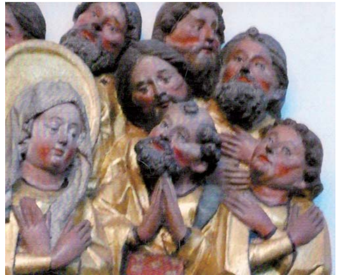
Abb. 3 Martini-Stadtkirche zu Stolberg im Harz. Muttergottes mit Petrus und anderen Bewunderern. Er ist einzig durch die cholerische Stirnlocke charakterisiert. Ausschnitt aus dem Bildteil des ehemaligen Hochalters, jetzt über dem Chorgestühl.

Petrus war der erste Jünger Jesu und der Apostel zur Bekehrung der Judenchristen. Später fungiert er auch als Nachfolger Christi auf dem Papststuhl in Rom. Er wird regelmäßig mit dem Schlüssel, Bart nach oben, als charakterisierendem Attribut dargestellt. Ab dem 4. Jahrhundert wird er zusätzlich als Rundkopf mit Glatze, Lockenkranz und Backenbart abgebildet, sowie mit einer