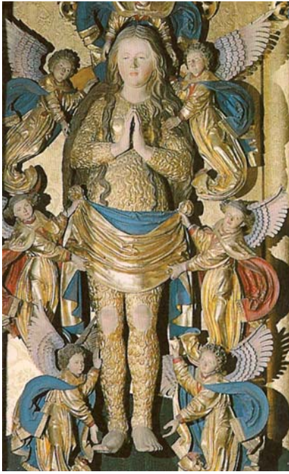
Abb. 1 Magdalenenalter des Lucas Moser in Tiefenbronn, Mittelteil bei Öffnung: Magdalena mit langem Haupthaar und Ganzkörperbehaarung, Ausparung von Gesicht, Brüsten, Händen, Füßen und Knien (Foto: H. & W. Sundermeyer).

den sie früher als „Wolfmensen“ oder „Affenmensen“ bezeichnet und „zur Schau“ gestellt sowie als Kuriositäten herumgereicht.