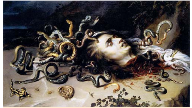
Abb. 4 Das Haupt der Medusa. Ölbild von Peter Paul Rubens 1617. Das ausgewogene Gesicht zeigt Erschrecken und ist von im Haar und aus dem Blut erwachsenen Schlangen eingenommen.

staltet wird. Dieses zeigt ein ovales, wohlgeformtes Gesicht mit feinen Zügen, mädchenhaft also die junge und sehr schöne Medusa, bevor sie von Pallas Athena mit dem Bann der Hässlichkeit geschlagen wurde. Meist zeigen diese Gesichtszüge ein erstauntes, ängstliches Erschrecken, wohl die Reaktion auf den eben wirksam werdenden Bann. Und um das Gesicht herum wird nun, Ovid folgend [11], das absolut ungewöhnliche und damit schreckliche, von Schlangen durchsetzte Haupthaar zur Bildfülle aufgebauscht. Ja die Schlangen entspringen auch dem Körper, an den blutbefleckten Stellen, wie sie drastischer als auf dem Rubensbild (► Abb. 4 ) kaum vermittelt werden können. Die Hässlichkeit des Fluches und der blutige Tod vollenden das viergliedrige Bildprogramm des Medusa-Mythos. Der Schreck des Fluchs wird hier nochmals wiederholt durch den Schreck der Enthauptung.