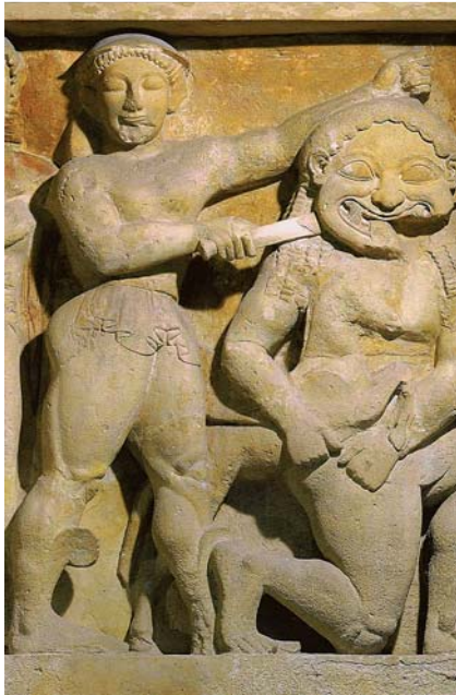
Abb. 1 Archaische Darstellung der Medusa, wie sie von Perseus enthauptet wird. Das frontal gezeigte Gesicht zeigt eine unförmig verbreiterte, eben besonders hässliche Mundpartie. Metope am Fries des Tempels von Selinunt in Sizilien, Halbrelief 540 v. Chr.