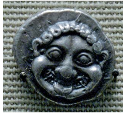
Abb. 2 Gorgonenhaupt der Medusa auf einer attischen Drachme, 520 v. Chr.

solches in Wort und Bild künstlerisch festgehalten und ausgeschmückt. Von besonderem Reiz aber scheint für die bildhafte Darstellung in Bild und Skulptur das Medusenhaupt zu sein. Dabei steht nicht die Wirkung der Versteinerung im Vordergrund, sondern das Objekt selbst, das Medusenhaupt als Sinnbild des Hässlichen. Versteinerungen gibt es viele, in allen Märchen, Legenden und Mythen. Selbst in der Bibel ist die Versteinerung von Lots Frau beim Rückblick auf das untergehende Sodom festgehalten (AT, 1 Mos. 19). Das Gorgonenhaupt aber gilt als das Hässlichste vom Hässlichen, als Schreckbild eines menschenähnlichen Gesichtes und ist von steter Faszination für jeden Betrachter. Es ist nicht verwunderlich, dass seine Darstellung eine immerwährende Herausforderung darstellt für Maler und Bildhauer.