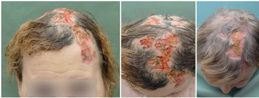
Abb. 1 Links und Mitte: unregelmäßig konfigurierte, großflächige, teils blutig-krustös belegte tiefe Ulzerationen mit Überschreitung der Mittellinie. Rechts: Verlaufskontrolle nach 16 Wochen.