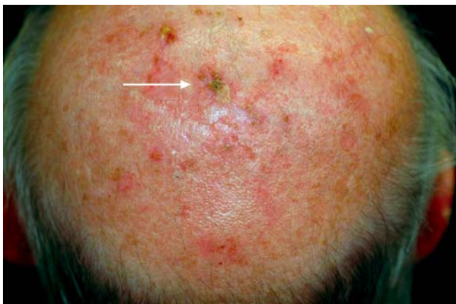
Abb. 1 Aufnahmebefund mit klinischer Darstellung einer Feldkanzerisierung des Capillitiums sowie einer stärker infiltrierten, bräunlich krustig belegten Plaque parieto-occipital (Pfeil), die histologisch einem Bowenkarzinom entsprach.

Im Rahmen der in Intubationsnarkose erneut durchgeführten PDT wurde die infiltrierte Hautveränderung parieto-occipital unter der klinischen Verdachtsdiagnose eines Plattenepithelkarzinoms exzidiert.