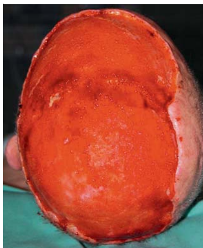
Abb. 3 Operations situs nach insgesamt 9 Exzisionen mit jeweils mikrografisch-kontrollierter Chirurgie. R1-Situation des mikrozystischen Adnexkarzinoms nach frontotemporal links.

Das Erreichen einer vollständigen Exzision des MAK wurde zunehmend unwahrscheinlich und wäre allenfalls nur durch eine gesichtsentstellende weitere Operation zu erreichen gewesen, d. h. Entfernung von Stirnhaut und Augenbrauen. Nach ausführlicher