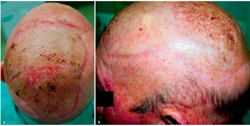
Abb. 4 Abschluss der operativen Maßnahmen 27 Tage (a) bzw. 6 Monate (b) nach Defektverschluss mittels Spalthauttransplantation.

wurden in der Literatur lediglich ca. 300 Fälle beschrieben [7]. Es wird ein diffus infiltrierendes Wachstumsmuster beobachtet. Die typische Lokalisation ist der zentrofaziale Bereich mit einem möglichen Überwiegen der linken Gesichtshälfte, das mediane Manifestationsalter liegt bei 65 Jahren (19–90 Jahre) [3]. Ausgehend von der bislang größten Fallsammlung von 48 Fällen besteht eine gewisse Bevorzugung des weiblichen Geschlechts (2:1) [3].