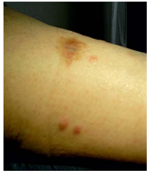
Abb. 1 Kutane Manifestation eines nodalen, großzellig-anaplastischen, ALK-negativen, CD30-positiven T-Zell-Non-Hodgkin-Lymphomes.

Therapie und Verlauf: Nach Vorstellung des Falls in der interdisziplinären Tumorkonferenz wurde eine Therapie mit 8 Zyklen CHOP-14-Chemotherapie (CHOP = Cyclophosphamid, Doxorubicin, Vincristin und Prednison) eingeleitet. Einer initia-