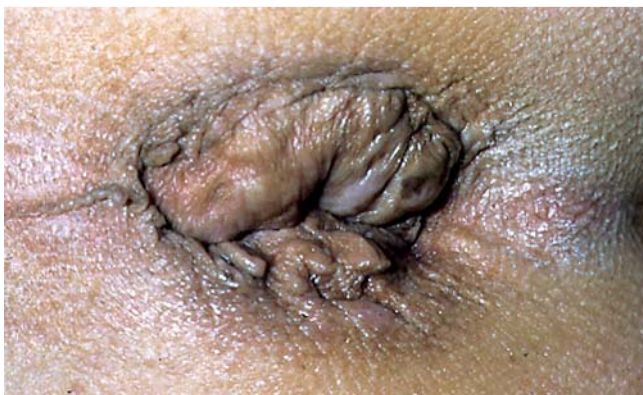
Abb. 13 Analprolaps.