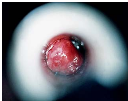
Abb. 6 Hämorrhoiden Grad 1 (im Proktoskop).