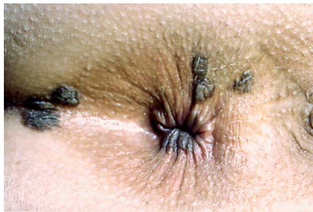
Abb. 4 Perianale intraepitheliale Neoplasie (PAIN).

Die anale (AIN) bzw. perianale (PAIN) intraepitheliale Neoplasie, früher als bowenoide Papulose bzw. Morbus Bowen bezeichnet, zählt zu den Vorläufern des Plattenepithelkarzinoms. Wie die Condylomata acuminata sind die Veränderungen HPV-assoziiert (überwiegend Typ 6, 11, 16 und 18) und demzufolge sexuell übertragbar. Risikofaktoren sind Rauchen, Immunsuppression bzw. -defizienz und riskantes Sexualverhalten (Promiskuität, Analverkehr). Nicht selten besteht eine Koinfektion mit HIV oder Herpes-simplex-Virus [13–15].