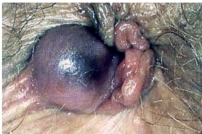
Abb. 9 Analthrombose.