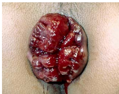
Abb. 7 Hämorrhoiden Grad 3 (Pressversuch).

Condylomata acuminata oder AIN bzw. M. Bowen lange Zeit vorausgehen können. Daneben kann sich ein Analkarzinom auch auf dem Boden von chronischem Ekzem, LSA, Lichen ruber oder bei Morbus Crohn als Begleiterkrankung entwickeln. Das Karzinom manifestiert sich zumeist als derber, oft verruköser hautfarbener bis rötlicher Knoten, der vor allem bei Exulzeration zunehmende Beschwerden wie Juckreiz, Nässen, Blutungen und Schmerzen verursacht. Inspektion, Palpation und digitale rektale Untersuchung liefern erste Hinweise für die Diagnose, die letztlich histologisch gesichert werden muss. Gleichzeitig sollte ein Staging erfolgen [2, 6, 14].