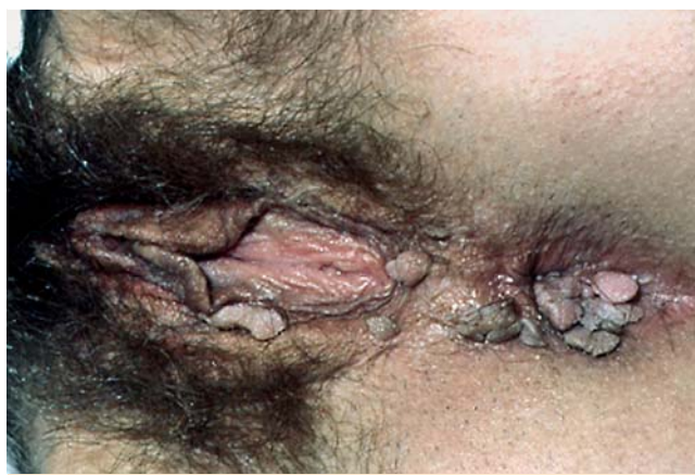
Abb. 3 Condylomata acuminata.

Beim Lichen sclerosus et atrophicus (LSA) handelt es sich um eine chronische kutane Bindegeweserkrankung unbekannter Genese, die mit Sklerosierung einhergeht. Frauen sind deutlich häufiger betroffen (Verhältnis etwa 6 : 1); der Erkrankungsgipfel liegt zwischen dem 50. und 60. Lebensjahr. Der LSA ist gekennzeichnet durch erythematöse Papeln, die in weißliche, atrophe Plaques übergehen. Die Veränderungen sind häufig im Anogenitalbereich lokalisiert (☛ Abb. 2). Die Diagnose wird in der Regel histologisch gesichert. Da sich auf dem Boden eines LSA ein Plattenepithelkar-