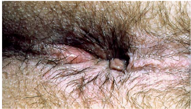
Abb. 10 Initialer Analabszess bei 6 Uhr SSL.

Bei der Analfissur handelt es sich um ein spindelförmiges Ulkus, das im distalen Analkanal zumeist (in ca. 80% der Fälle) im Bereich der hinteren Kommissur (bei 6 Uhr in SSL) lokalisiert ist (● Abb. 12). Die Ursache ist ungeklärt; es wird eine multifaktorielle Genese angenommen, wobei übermäßiges Dehnen durch harten und sehr voluminösen Stuhl, eine verminderte Elastizität des Analkanals und/oder eine Kryptitis die Entstehung zu begünstigen scheinen. Häufig kommt es zu einem Circulus vitiosus von Schmerzen, erhöhtem Sphinktertonus, mangelnder Durchblutung bzw. Heilungstendenz, entzündlichen Prozessen und