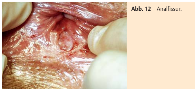
Abb. 12 Analfissur.

schließlich zu Sekundärveränderungen (hypertrophe Analpapille, Vorpostenfalte, Fistel, narbige Analstenose) und dadurch zur Chronifizierung. Auch sekundäre Fissuren infolge einer Reihe anderer Grunderkrankungen werden beobachtet. Charakteristisches Symptom ist ein stechender, brennender oder dumpfer Schmerz während, oft auch nach der Stuhlentleerung, der häufig von einer Blutung begleitet ist. Im Zuge der Chronifizierung lassen die Symptome nach. Die Diagnostik erfolgt in der Regel mittels Inspektion, Palpation und Proktoskopie [2, 6, 21]. Bei der Behandlung muss zwischen akuter und chronischer Form unterschieden werden. Therapieziel ist es, den Sphinktertonus zu senken, um den Circulus vitiosus zu durchbrechen. Daneben sind stuhlregulierende Maßnahmen mit ballaststoffreicher Ernährung und ausreichender Flüssigkeitszufuhr zu empfehlen (● Tab. 6). Die Behandlung der akuten Form erfolgt konservativ. Eine protrahierte Dehnung des Sphinkters lässt sich durch Anwendung eines Analdehners erreichen: Dabei wird der Dehner durch den Patienten selbst zweimal täglich nach Auftragen einer