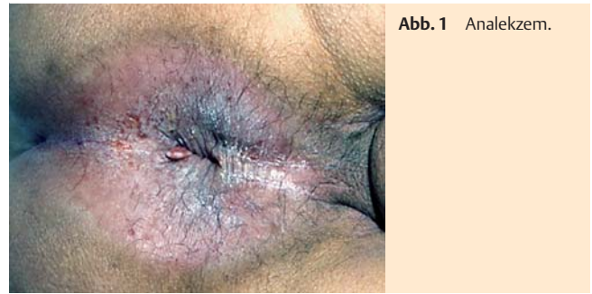
Abb. 1 Analekzem.

*Dermatosen, die im Text und z. T. auch mit klinischen Bildern ausführlicher erläutert werden.