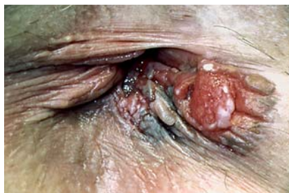
Abb. 5 Analrandkarzinom.