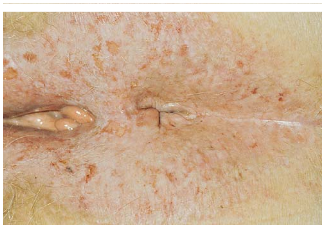
Abb. 2 Lichen sclerosus et atrophicus.

(DKG) umfassen und kann ggf. durch weitere DKG-Testreihen ergänzt werden. Empfohlen werden Externa-Inhaltsstoffe, Lokalanästhetika, topische Antibiotika, Antimykotika, Kortikosteroide und Konservierungsmittel [8, 10].