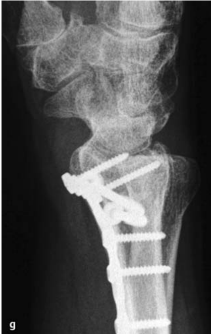
Abb. 2g Geringfügige Kippung der Radiusgelenkfläche frühpostoperativ in der Seitenaufnahme nach dorsal.

ber hinaus beeinträchtigt der deform verheilte Radius die Weichteile, insbesondere den N. medianus und die über ihn hinwegziehenden Sehnen-Muskel-Einheiten.