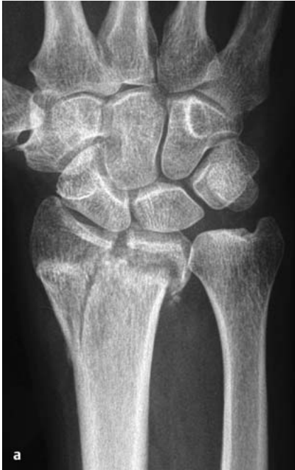
Abb. 2a Mit Spalt- und zugleich Stufenbildung fehlverheilte intraartikuläre Radiusfraktur eines 57-jährigen Mannes.