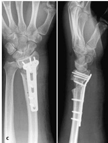
Abb. 4c Frühpostoperative Situation: Der Radius ist in Form und Länge wieder hergestellt. Der eingebrachte Beckenkammblock wurde mittels einer Hohlfräse mit einem Durchmesser von 2 cm entnommen. Er füllt den Osteotomiespalt nicht vollständig ist.

Bei der Wahl des Zugangs für die Radiuskorrekturosteotomie gilt es zu berücksichtigen, ob gleichzeitig neben der Fehlstellung des distalen Radius eine korrekturbedürftige karpale Instabilität vorliegt und synchron ein Eingriff am dis-