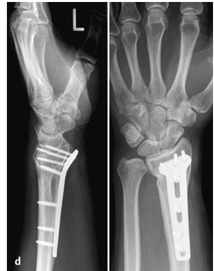
Abb. 4d Nach wenigen Wochen ist der Knochenblock vollständig integriert und der Osteotomiespalt bereits fast komplett mit Knochen aufgefüllt. Bei dem sehr kräftigen Patienten ist es trotz Verwendung eines sehr stabilen, winkelstabilen, speziell für die Radiuskorrekturosteotomie von uns entwickelten Implantats und trotz Interposition eines bikortikalen Knochenblocks in den Osteotomiespalt zu einem leichten Korrekturverlust gekommen. Ausdruck dafür ist die Prominenz der Platte distal-palmar und der Umstand, dass eine Schraube gebrochen ist. Dies unterstreicht die Bedeutung der Wahl des Osteosynthesematerials und des Umgangs mit dem Osteotomiespalt insbesondere bei länger bestehenden Fehlstellungen und sehr kräftigen Männern.

Es ist zwar technisch einfacher, die Osteotomie proximal der ursprünglichen Fraktur vorzunehmen, dies kann jedoch zu erheblichen Problemen führen. So kann es zu Subluxationen im distalen Radioulnargelenk und einer Knickbildung des Radius am Übergang der Metazur Diaphyse (Humpback-Deformität) kommen. Letztere führt zu einer gestörten Druck- und Kraftübertragung von der Hand auf den Unterarm mit der Gefahr der Refraktur bei Entfernung des Osteosynthesematerials. Von daher ist es ratsam, die Osteotomie weit distal im Bereich der ursprünglichen Fraktur anzulegen.