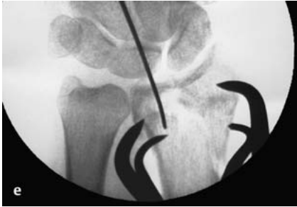
Abb. 2e Intraoperative Durchleuchtung: Spalt- und Stufenbildung wurden ebenso wie das Längenverhältnis ausgeglichen. Provisorische Fixation mit Repositionszangen.