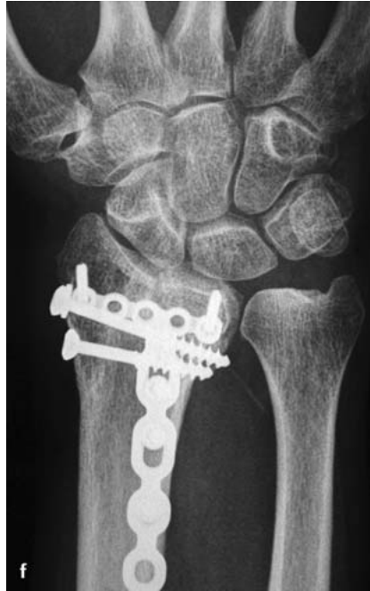
Abb. 2f Das frühpostoperative Röntgenbild in Draufsicht zeigt noch eine verbliebene geringe Stufe der Radiusgelenkfläche. Der Radius ist ansonsten in Form und Länge gut wiederhergestellt.

Die Kraftübertragung erfolgt am unverletzten, gesunden Handgelenk zu 15–30% über die Ulna und zu 70–85% über den Radius. Am Radius verteilt sich die Kraftübertragung im Verhältnis 60:40 auf die Fossa scaphoidea und die Fossa lunata. Die Fehlstellung des distalen Radiusfragments beeinflusst sowohl die Kraftübertragung am gesamten Handgelenk als auch die Druckverteilung am Radius. Bei Dorsalkippung des distalen Radiusfragments kommt es unter Verschmälerung der Belastungszone zu einer Verlagerung der Belastungszone