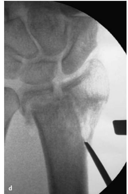
Abb. 2d Intraoperative Durchleuchtung: Aufsuchen des ehemaligen Frakturspalts unter Bildwandlerkontrolle mit dem Meißel.

nis zur Ulna. In 50% der Fälle besteht zusätzlich ein Drehfehler des distalen Radius gegenüber dem Radiuschaft [7]. Des Weiteren findet sich gelegentlich ein Versatz der Radiuskonsole nach dorsal oder palmar und/oder radial.