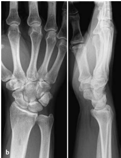
Abb. 4b Röntgenaufnahme der unverletzten Gegenseite.

Indikation gegeben ist, die Schwellung rückläufig und die Fingerbeweglichkeit ordentlich ist [3].