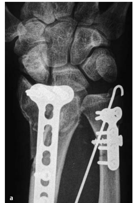
Abb. 1 a Palmare winkelstabile Plattenosteosynthese des distalen Radius mit in der Draufsicht bereits erkennbarer Fehllage des Osteosynthesematerials.

Bei extraartikulärer Fehlstellung findet sich meist eine Kombination aus einer Abflachung der Ulnarinklination des Radius und einer Verkippung der Radiuskonsole nach dorsal oder palmar als auch einer Verkürzung des Radius im Verhält-