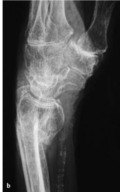
Abb. 3b Auch im seitlichen Röntgenbild zeigt sich eine Fehlstellung des distalen Radius mit vermehrter Palmarkippung der Radiusgelenkfläche. Wiederum ist die erhebliche Arteriosklerose sowie eine Arthrose des Daumensattelgelenks zu erkennen.

Ulnakopfs durch eine Prothese [14]. Als Eingriffe zur Wiederherstellung „normaler“ anatomischer Verhältnisse sind Ulna-Verkürzungsosteotomie und Radiuskorrekturosteotomie zu nennen.