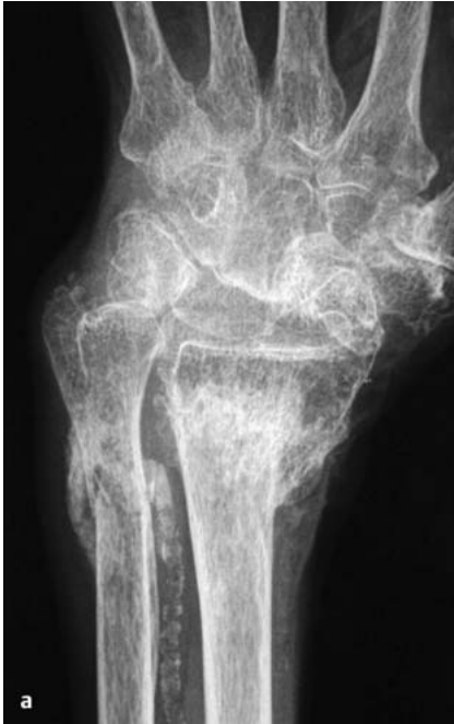
Abb. 3a Kontraindikation gegen eine Radiuskorrekturosteotomie trotz erheblicher Verkürzung und Aufhebung der Ulnarinkliniation des distalen Radius bei massiver Osteoporose, erheblichen arteriosklerotischen Verkalkungen und Derangierung des Karpus.