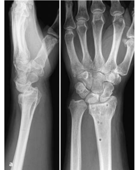
Abb. 4a Trotz Plattenosteosynthese in erheblicher Fehlstellung mit Dorsalkippung der Radiusgelenkfläche von 40° und mit Verkürzung von mehreren Millimetern ausgeheilte Radiusfraktur eines 44-jährigen Mannes. Die Entfernung des Osteosynthesematerials ist bereits erfolgt.

Finden sich Zeichen eines akuten komplexen regionalen Schmerzsyndroms, ist der Eingriff trotzdem indiziert, sofern die Fehlstellung und z.B. die hierdurch bedingte Irritation des N. medianus als auslösendes Moment gesehen werden. Eine abgelaufene Algodystrophie ist nicht als Kontraindikation zu werten, allerdings sollte die Fingerbeweglichkeit möglichst nicht mehr eingeschränkt sein. Aufgrund der winkelstabilen Implantate spielt heute die Knochenqualität eine untergeordnete Rolle, sodass auch eine Osteoporose keine absolute Kontraindikation mehr darstellt.