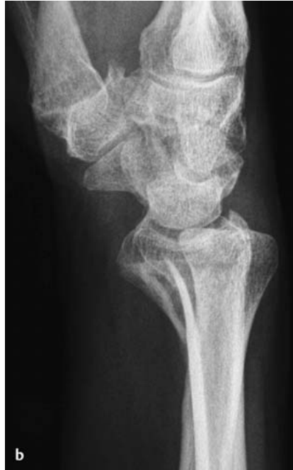
Abb. 2b Die Seitenaufnahme zeigt einen zusätzlichen Versatz des distalen Fragments nach palmar.