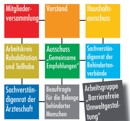
Abb. 7 Die Gremien der BAR.

dem umfassenden Rehabilitationsgedanken gerecht zu werden. Integration wird als gesamtgesellschaftliche Aufgabe verstanden, denn ein Rehabilitationserfolg kann langfristig nur gesichert werden, wenn technische, soziale und Barrieren im „Kopf“ beseitigt werden. Die Arbeitsgruppe versteht sich als Fachforum, in dem Ideen und Informationen ausgetauscht sowie Stellungnahmen erarbeitet werden (► Abb. 7 ).