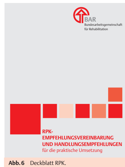
Abb. 6 Deckblatt RPK.

Seit 1982 besteht die BAR-Arbeitsgruppe „Barrierefreie Umweltgestaltung“. Sie hat sich zum Ziel gesetzt, die gesellschaftliche Partizipation von Menschen mit Behinderungen und chronisch kranken Menschen zu fördern und so