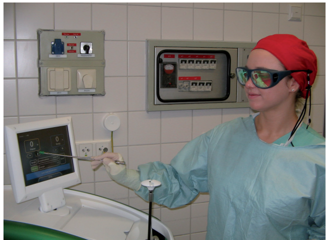
Abb. 2 Der mit einer Arbeitskanal-Gummidichtung armierte Mandrain des Instrumentenschäfts löst den interaktiven Bildschirm des Lasers sicher aus ohne ihn zu verkratzen.