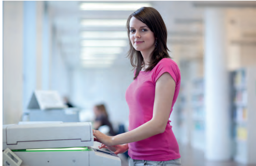
Wissenschaftliche Poster kann man in Rechenzentren von Unis oder in gut ausgestatteten Copy-Shops drucken.

DIN-A0-Ausdrucke (841x1189 mm) auf mattem 170-g-Papier oder auf Fotoglanzpapier gibt es bei Online-Druckereien bereits ab 25 Euro. Für die wetterfeste Versiegelung (Laminierung) kommen rund 20 Euro hinzu. Die Laminierung empfiehlt sich, wenn Sie das Poster mehrmals nutzen oder wenn es längere Zeit im Institut oder der therapeutischen Einrichtung hängen soll. Wie die Daten zum Drucker kommen, erfragen Sie am besten vor Ort. In der Regel können Sie sie per E-Mail oder auf CD-ROM liefern, am besten als druckfertige Datei im PDF-Format. Viele Hochschulen haben auf ihrer Website Leitlinien zur Postererstellung und Datenübermittlung veröffentlicht, zum Beispiel die Uni Lübeck unter www.itsc.uni-luebeck.de > „Dienstleistungen“ > „IT-Basisdienste“ > „Posterdruck“.