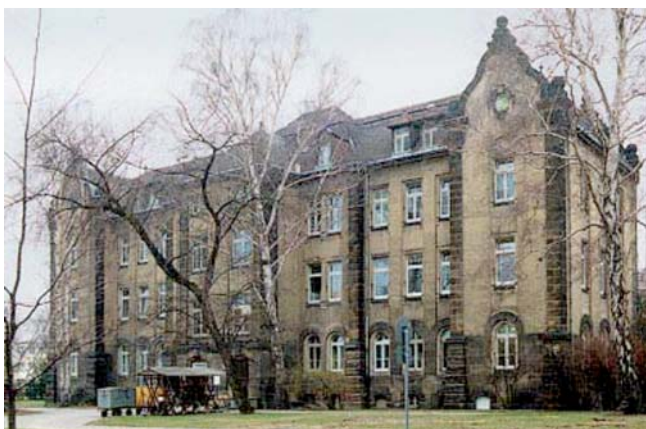
Abb. 2 Das Gebäude, Haus 15, der Hautklinik.

Im September 1957 wurde die Hautabteilung der bis dahin städtischen Poliklinik Johannstadt angegliedert. Ein junges Ärzteteam, das sich vorwiegend aus den ersten Absolventenjahrgängen der Medizinischen Akademie Dresden rekrutierte, ergänzt durch eine Biologin und später noch einen Chemiker, arbeitete sich engagiert in die verschiedenen Bereiche der Dermato-Venerologie (wie sie damals nicht ohne Grund noch hieß) ein. In den Folgejahren entwickelte sich die Klinik trotz der Mühen des sog. „gleitenden Aufbaus“, d. h. stufenweise, mit diversen Bau- und Rekonstruktionsmaßnahmen bei vollem Aufgabenspektrum in Patientenbetreuung, Lehre, Weiterbildung und Forschung erstaunlich zügig zu einer vollwertigen und leistungsfähigen Hochschul-Hautklinik. Sie zählte maximal 100 Betten auf 4 Stationen mit etwa 1200 Patienten jährlich und einer durchschnittlichen Verweildauer von 28 Tagen.