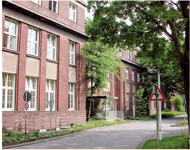
Abb. 8 Das Gebäude der Hautklinik Krefeld – Übersicht.