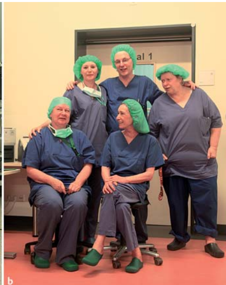
Abb. 7 Hautklinik Krefeld. a Eingriffsraum 1. b Das OP-Team.