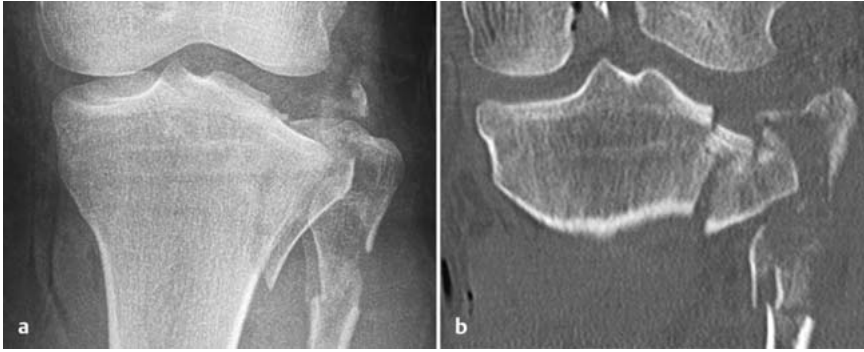
Abb. 3a und b a Röntgen Kniegelenk links. Tibiakopfaktur und hohe Fibulakraaktur als Hinweis für eine stattgehabte Knieluxation. b Korrespondierende CT-Aufnahme frontal, Kniegelenk links.