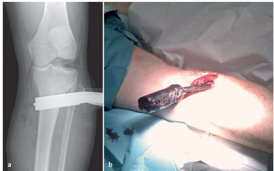
Abb. 2a und b a Röntgen Knie a.-p. Vermehrte laterale Aufklappbarkeit als Hinweis für eine stattgehabte Knieluxation. Fremdkörper (Handbremse). b Klinisches Bild Fremdkörper.

nach Darstellung des Risses direkt End zu End genäht oder durch ein Interponat versorgt. Nach Versorgung der Gefäßverletzung sollte eine prophylaktische Kompartment-Spaltung durchgeführt werden. Bei Vorliegen eines großen offenen Weichteilschadens ist ggf. die Anlage eines Vakuumverbands notwendig. Bei der notfallmäßigen Versorgung sollte zur Stabilisierung des Kniegelenks ein Fixateur externe angebracht werden. Wenn möglich sollten die Schanzschrauben dabei mindestens 10 cm oberhalb und unterhalb der Gelenklinie eingebracht werden, um nicht mit einem geplanten Bohrkanal bei der endgültigen Versorgung zu interferieren. Als Alter-